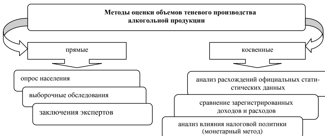
Рис. 2 Методы оценки объемов теневого производства алкогольной продукции

Методик измерения «теневого» объема производства алкогольной, в том числе винодельческой, продукции существует много. Следует отметить, что ни одна из них не дает стопроцентно достоверного результата, а результаты значительно разнятся. Эксперты «теневого» рынка винодельческой продукции выделяют две группы методов оценки объемов нелегального производства: прямые и косвенные (рис. 2) [6].