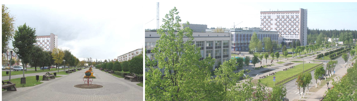
Рис. 1. Бульвар около общегородского центра Новополоцка, улица Кирова (существующее положение)

Безусловно, по прошествии почти 50 лет архитектурный облик Новополоцка требовал изменений. В связи с этим за последние несколько лет был произведен ряд реконструктивных мероприятий по модернизации и улучшению архитектурного облика, а также благоустройству центральной части города, которые обновили и «освежили лицо города». Самым значительным изменениям подверглись здание Горисполкома и площадь Строителей. Изменился внешний облик Дома торговли и Дома быта. Был создан бульвар на улице Кирова (рис. 1). Но все эти изменения не являются кардинальными, а это говорит о том, что и они в ближайшее время потребуют модернизации. Так как площадь Строителей является главной репрезентативной частью города, то к её реконструкции нужно подходить особенно серьезно.