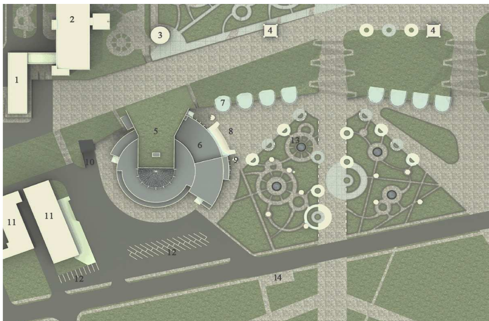
Рис. 4. Фрагмент генерального плана центральной части Новополоцка (проектное предложение): 1 – столовая общежития № 2 УО «ПГУ»; 2 – общежитие № 2 УО «ПГУ»; 3 – городской общественный туалет; 4 – выход из подземной автостоянки; 5 – зеленая эксплуатируемая кровля театра; 6 – малый драматический театр «АРТ»; 7 – навес; 8 – входная зона театра; 9 – стенд для афиш; 10 – въезд в подземную автостоянку; 11 – дом детского творчества; 12 – автостоянка; 13 – фонтан; 14 – остановка общественного транспорта

В здании спортивного комплекса «Атлант», расположенного по улице Молодежная, 49А, предлагается расположить дом детского творчества. Сам спортивный комплекс предлагается перенести, вместе со стадионом, в центр восточного жилого района Новополоцка.