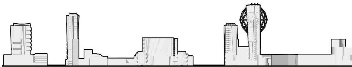
Рис. 3. Развертка застройки по улице Молодежная (проектное предложение)

Проектное предложение. По проекту предполагается визуально выделить центр, «обрамив» его четырьмя доминантами (используя один из приемов размещения групповых вертикалей в городском центре – контурный). Предлагаемые доминанты: новый корпус гостиничного комплекса «Беларусь» (предлагается расположить на главной визуальной оси Новополоцка – в направлении от перекрестка по улице Калинина к площади Строителей); офисно-досуговый центр (предлагается расположить на второй по значимости визуальной оси города – в направлении от перекрестка по улице Ктаторова к площади Строителей), многоквартирный жилой дом-вставка и лабораторно-исследовательский корпус УО «Полоцкий государственный университет» станут второстепенными, поддерживающими проектируемый ансамбль, доминантами (рис. 3).