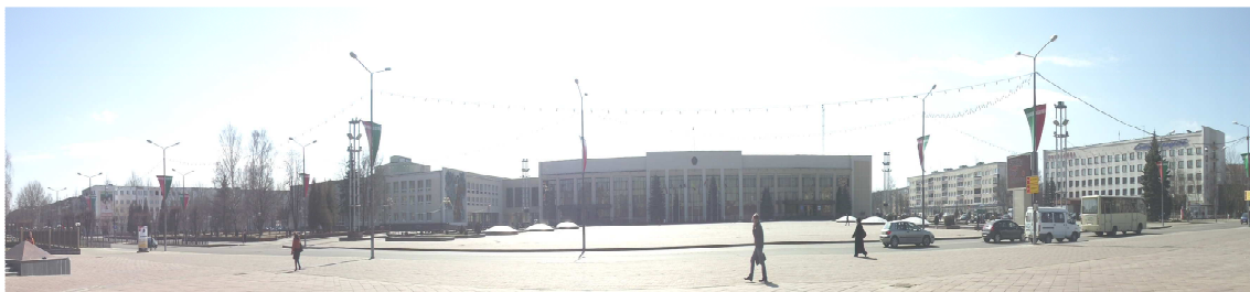
Рис. 2. Панорама общегородского центра Новополоцка, ул. Молодежная (существующее положение)

На данный момент требуются кардинальные меры по «выделению» центральной части города Новополоцка из общей массы невыразительной (по высотности) застройки города, продолжающего расти, но так и не имеющего доминант. Основная застройка Новополоцка колеблется в пределах 5...9-ти этажей. К центральной части города примыкают в основном пятиэтажные жилые дома, а общественные здания в среднем не превышают трех этажей (рис. 2). Такая небольшая разница в высотности зданий создает однообразную линию застройки центральной части города.