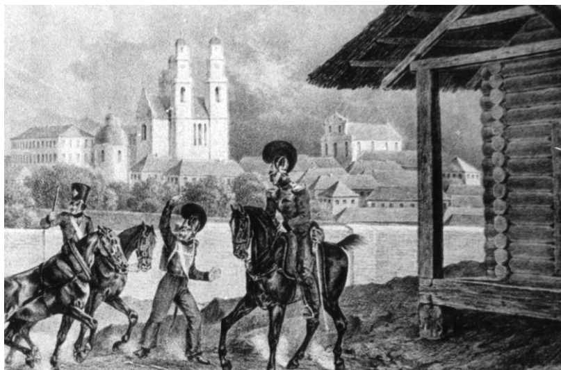
Рис. 1. Полоцк, 25 июля 1812 года (БГАКФД) (Х.В. Фабер дю Фор. Фрагмент рисунка)

Так, на рисунке Полоцка 25 июля 1812 года (рис. 1), выполненном французским художником Х.В. Фабер дю Фором [6], мы можем достаточно четко себе представить, как выглядел доминиканский костел Божьей Матери в своем первоначальном, барочном виде. Более детально этот памятник можно увидеть на реконструкциях, выполненных Ю.В. Чантурия (рис. 2) [7, с. 283, 285]. Костел представлял собой трехнефную, шестистолпную базилику [8, с. 449]. Центральный неф завершался полуциркулярной апсидой (30×18,9) с прямоугольными нишами, равной с ним по высоте и завершающейся округлым щитом (рис. 3). Его главный фасад имел трехъярусную (соотношение сторон ярусов 17 м : 6,6 м : 3,4 м или примерно 5 : 2 : 1) ступенчатую композицию с довольно компактным силуэтом, с выразительным барочным щитом.