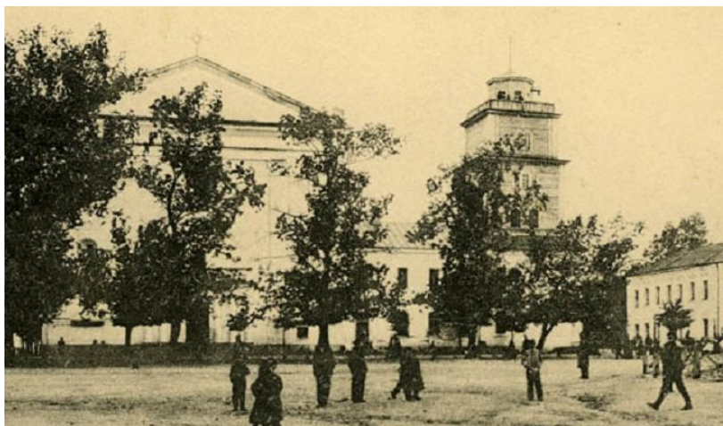
Рис. 5. Полоцк. Костел Каланча. Открытка начала XX века

никанским костелом (рис. 6) и обелиском в память 1812 года. По высоте каланча практически была ровень с вершиной фронтона костела. За счет горизонтальных членений и постепенного уменьшения объемов по вертикали, «башня» приобрела своеобразный силуэт.