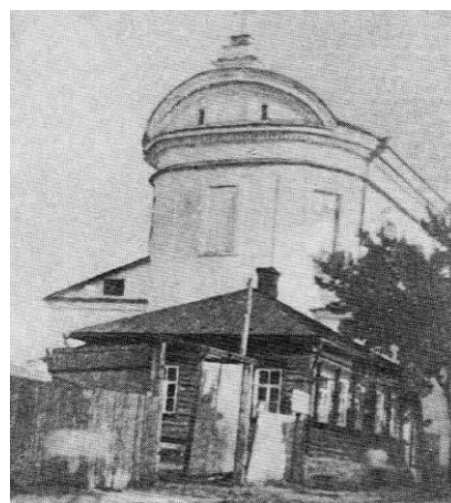
Рис. 3. Доминиканский костел Божьей Матери. Вид на апсиду

В принципе, доминиканский костел являлся примером архитектуры переходного периода от барокко к классицизму. То есть, с одной стороны, в нем довольно четко прослеживается барочное стремление концентрировать выразительные средства на главном фасаде, в том числе и мягкие плавные линии щита, декоративные вазы и т.д. Но с другой – уже весьма отчетливо ощущается влияние классицизма. Главный вход со стороны Парадной площади был оформлен шестиколонным портиком с балконом вместо фронтона. Малый ионический ордер портика гармонично сочетался с большим также ионическим ордера пилястра на фасаде. С балкона был вход на хоры.