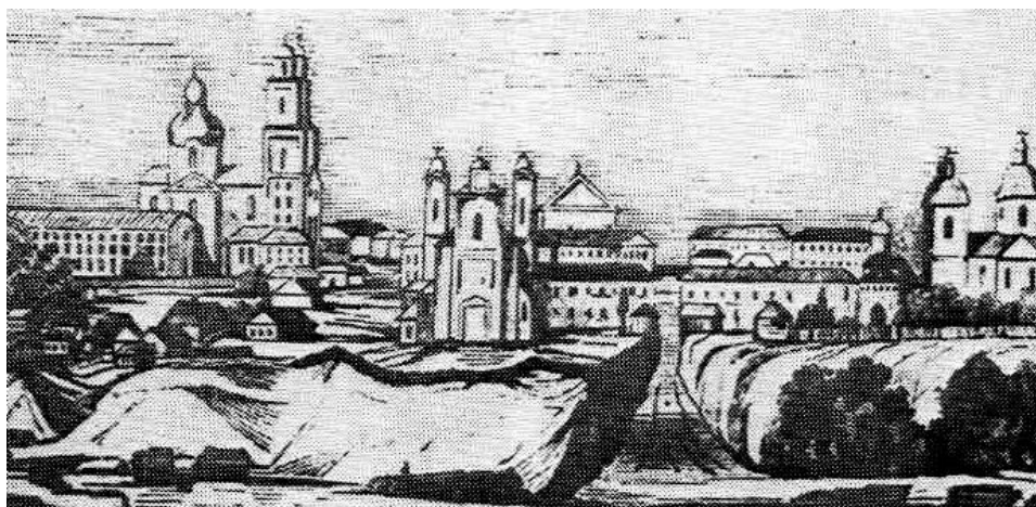
Рис. 4. Вид на Полоцк. Первая половина XIX века

Так, на рисунке Фабер дю Фора костел предстает еще в своем барочном виде, а на рисунке первой половины XIX века (рис. 4) уже четко прослеживаются элементы классицизма. На этом рисунке еще отсутствует обелиск в честь взятия Полоцка русскими войсками в 1812 году, построенный в 1850 году. Соответственно, возможно, что в этом промежутке между пожарами и возведением обелиска костел и получил свой новый облик. По-видимому, монастырь не подвергся кардинальным изменениям. Только на главном фасаде барочный щит с мягкими линиями заменен строгим геометричным фронтоном. В интерьере костела было пять алтарей, украшенных резьбой по дереву и красочной росписью. В некоторых источниках [9] упоминается, что на хорах располагался двенадцатиголосый орган. Монастырский корпус представлял собой двухэтажное Г-образное в плане здание с коридорной планировкой. Первый этаж имел сводчатые перекрытия, а второй – простые деревянные.