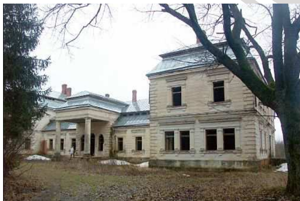
Рисунок 2 – Вид на усадьбу Плятеров

Центром архитектурной композиции усадьбы является главный корпус, отдаленный от дороги, с обширным парадным партером и задним фасадом, выходящим на пологий склон холма, по которому идёт широкая лестница к берегу озера [4].