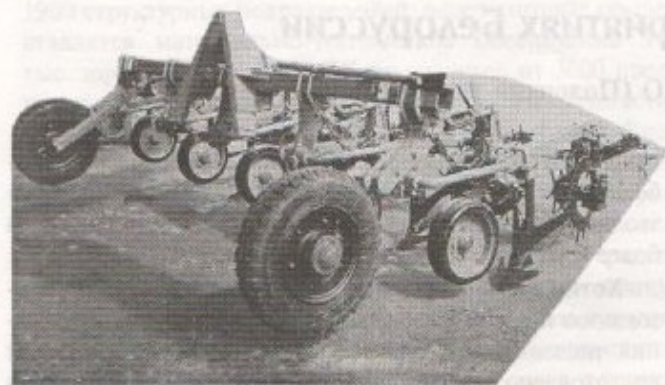
Рис. 1. Окучник-культиватор АК-2,8

Каждая секция рабочих органов состоит из шарнирного четырехзвенника, опорного колеса, механизма регулирования глубины обработки и грядилца, на котором крепятся рабочие органы — окучивающие корпуса с универсальными лапами, а также роторные боковые и гребневые рыхлители. Шарнирный четырехзвенник кинематически соединяет окучивающий корпус с опорным колесом и при обработке почвы обеспечивает копирование ее рельефа и постоянную высоту гребня. Глубину обработки регулируют. Число секций на одну больше, чем число обрабатываемых гребней.