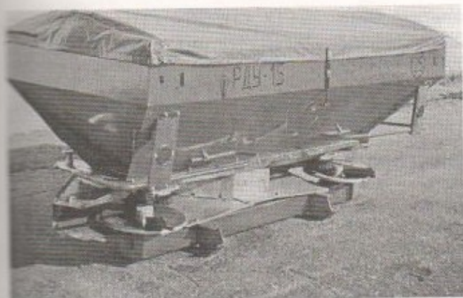
Рис. 2. Дисконный разбрасыватель РДУ-1,5

ется его модификация для обработки почвы под посадку моркови и свеклы с междурядьями 45 и 70 см. Намечается установка приспособления для внесения гербицидов и жидких удобрений.