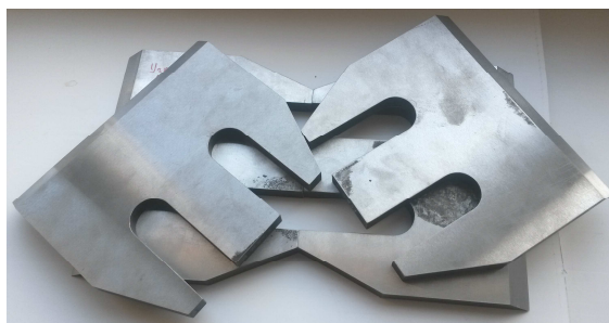
Рисунок 3 – Опытные образцы ножей для рубки щепы ФТИ5.001.1685

Испытания ножей для рубительных машин на ЗАО «Холдинговая компания «Пинскдрев». В соответствии с договором с ЗАО «Холдинговая компания «Пинскдрев» № 2013/122 от 18.06.2013 проведены предварительные испытания опытных образцов ножей ФТИ5.001.1685 (1 комплект) для рубительной машины ДО-51, которые были изготовлены на опытном производстве в Физико-техническом институте НАН Беларуси (рис. 3, акт изготовления № 4.2/1).