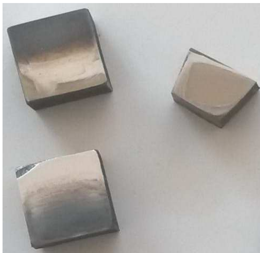
Рисунок 5 – Шлифы из опытных образцов ножей

Исследования механических свойств ножей для рубительных машин после проведения предварительных испытаний. Из испытанных образцов ножей методом электроэрозионной резки вырезались специальные образцы (рис. 5) с целью изготовления шлифов для металлографических и дюраметрических исследований механических свойств образцов (твердость, ударная вязкость), которые проводились по стандартным методикам [3; 4].