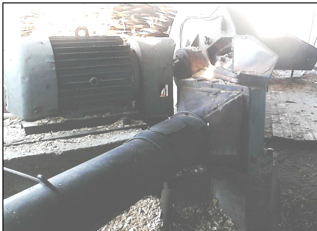
Рисунок 1 – Рубительная машина МРГ-20 на ОАО «Минскдрев»

Результаты, полученные в ходе испытаний исследуемых ножей, позволили рекомендовать их к использованию на деревообрабатывающих предприятиях после доработки конструкторской документации и технологии изготовления с целью повышения стойкости непрерывной работы ножей до 420 мин и более.