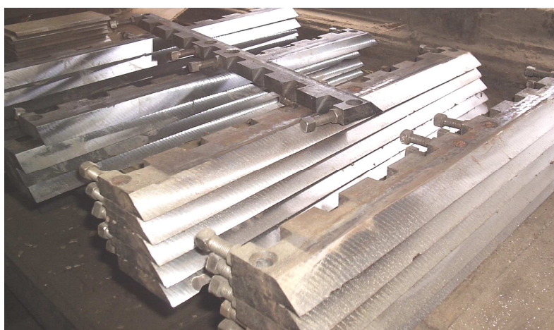
Рисунок 4 – Опытные образцы ножей для рубки щепы ФТИ5.001.1675

Испытания ножей для рубительных машин на ОАО «Витебскдрев». В соответствии с договором с ОАО «Витебскдрев» № 2013/118 от 28.06.2013 проведены испытания опытных образцов ножей ФТИ5.001.1675 длиной 700 мм (1 комплект) для рубительной машины МРН-100 (Россия), которые были изготовлены на филиале ЗАО «Атлант» – БСЗ (рис. 4).