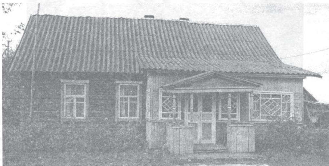
Мал. 7. Балясіны ў афармленні ўваходу (в. Валасачы, Чашніцкі раён)

Характэрным для сучаснай беларускай вёскі ўпрыгожваннем становіцца афарбоўка сцен хаты або яе асобных дэталей – аконнай ліштвы, кутоў, франтонаў. Гэты від аздабы ў старой вясковай архітэктурцы сустракаўся выключна рэдка [5, с. 70]. Колеравы дэкор атрымаў распаўсюджванне ў выглядзе манахромнай пафарбоўкі, поліхромнай пафарбоўкі і мастацкага роспісу. Інтэнсіўнае развіццё гэтага кшталту аздабы адбываецца з 1960-х гадоў. Такі від дэкору, як іншародныя накладкі і ўстаўкі з металу, шкла, пластыку і іншых матэрыялаў, афактурванне сценаў, сустракаецца ў народным жылле з пачатку 1970-х гадоў і мае тэндэнцыю да шырокага распаўсюджвання [2, с. 102 – 103]. Ужыванне новых матэрыялаў (цэглы, шлакабетону) у сельскім будаўніцтве выклікае змены і ў дэкаратыўных элементах. Але перавага і ў новым будаўніцтве аддаецца традыцыйным упрыгожванням ці імітацыі пад іх (мал. 9). У цагляных і шлакабетонных дамах франтон часта робіцца з шалёўкі з узорным выкладаннем. У гэтых жа дамах пры дапамозе размалёўкі па старадаўніх узорах ствараецца імітацыя пад традыцыйныя драўляныя вуглы і аконную ліштву [5, с. 70].