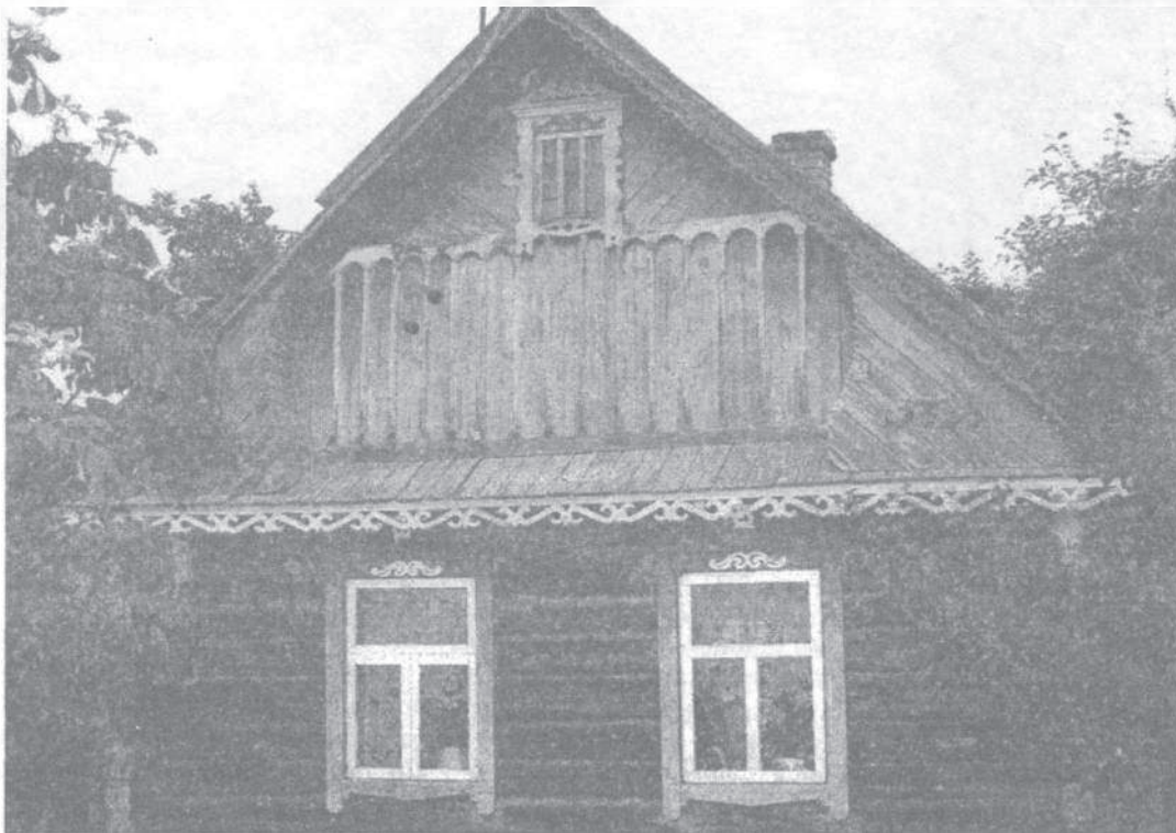
Мал. 5. Кампазіцыйнае вылучэнне франтона. Полацкі раён

Падыход да вырашэння дэкаратыўнага аздаблення пабудоваў, найперш жылых дамоў, быў наступны. У Падзвінні ўпрыгожвалі асноўным чынам галоўны фасад дома (гзымс, лішты, франтон, куты зруба), але заўжды ў дэкоры вылучаўся асноўны элемент – ці вокны, ці дзверы, ці франтон (мал. 5). Іншыя элементы ўбрання кампазіцыйна яму падпарадкоўваліся [3, с. 40].