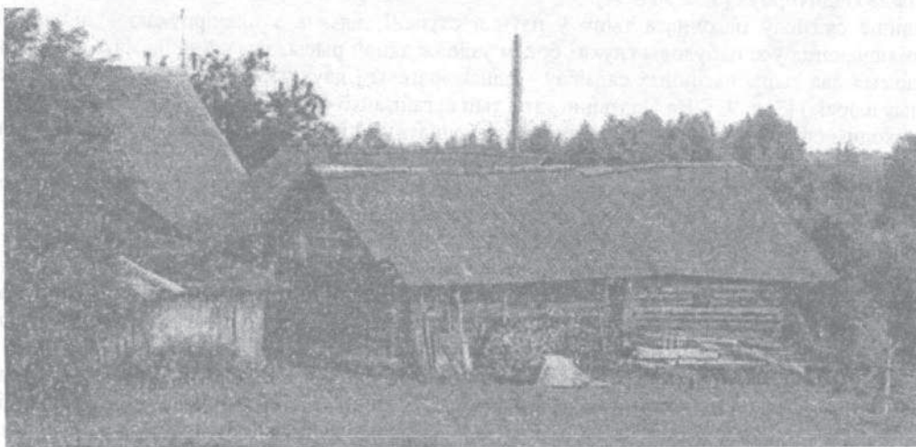
Мал. 1. Сядзіба з крытым дваром. В. Селэне (Бароўка), Латгалія

Самым пашыраным тыпам сядзібнай забудовы на Падзвінні здаўна з'яўляўся двор-комплекс, дзе пабудовы размяшчаюцца вельмі кампактна, гаспадарчыя памяшканні шчыльна прылягаюць да жылга, утвараючы адзіны жыллёва-бытавы комплекс з крытым дваром (мал. 1). Такая планіроўка забяспечвала надзейную абарону ад ветру і снегу ва ўмовах халоднай зімы [4, с. 53]. Важна тое, што дадзены тып арганізацыі двара вядомы толькі ў гэтым беларускім рэгіёне.