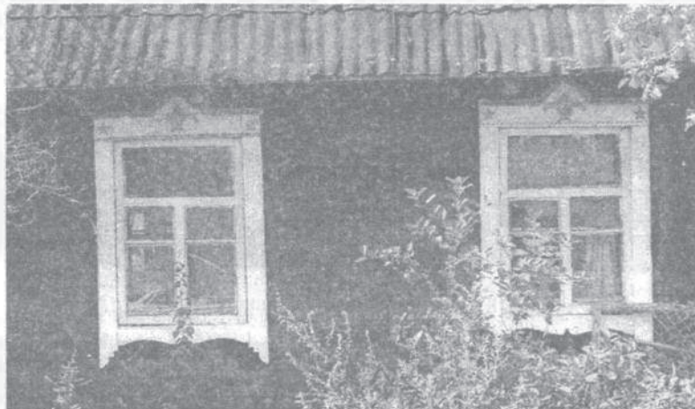
Мал. 6. Спалучэнне дэкаратыўных матываў. Вушачы

На паўднёвым захадзе рэгіёну распаўсюджаныя нізкія брамы і слаба дэкараваныя агароджы, якія граюць малую дэкаратыўную ролю ў комплексе жылля [2, с. 106].