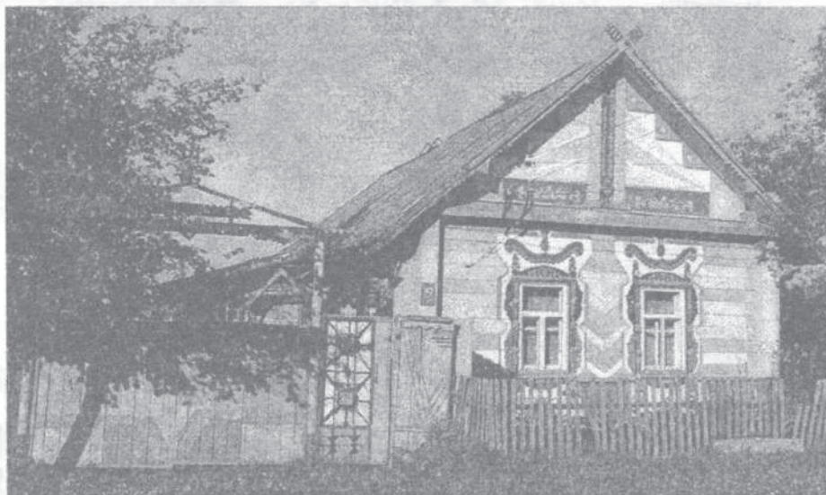
Мал. 9. Імітацыя прыёмаў традыцыйнага дойлідства дэкаратыўна-выяўленчымі сродкамі (в. Чарэя, Чашніцкі раён)

Такім чынам, упрыгожванні беларускага народнага жытла на Падзвінні даволі багатыя і разнастайныя. Яны ў значнай ступені ўзмацняюць своеасаблівасць ансамбля жылля рэгіёну, вызначаюць яго каларыт.