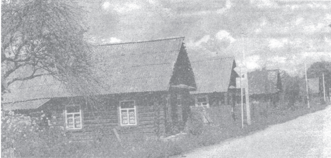
Мал. 3. Вуліца ў Вушачах

лазня – звычайная пабудова практычна ў кожнай сядзібе. А ў заходніх і паўднёвых раёнах сяляне заўжды мыліся дома [3, с. 40].