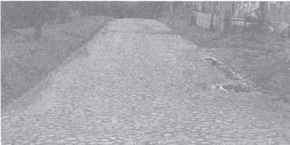
Мал. 4. Брукаваная вуліца ў Шаркаўшчыне

Калі казаць пра мясцовыя будаўнічыя матэрыялы, то трэба адзначыць, што ў Падзвінні шырока выкарыстоўваліся сабраныя на палях камяні для падмуркаў [3, с. 40], брукаванкі вуліцаў (мал. 4), панадворкаў, сценак студняў, нават сеняў у хаце.