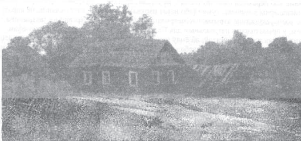
Мал. 2. Двор-комплекс у Гарадку

дзянніка – гаспадарчага двара, на які вяла адна ці некалькі брамаў. Хлеў з дзянніком і хату пачынаюць перакрываць самастойна прымыкаючымі двусхільнымі дахамі. Сены ператвараюцца ў развіты сувязуючы вузел, кампазіцыйны і камунікацыйны цэнтр усяго двара. Праз іх праходзяць сувязі паміж хатай і варыўняй, або двума хатамі, а таксама паміж чыстым і гаспадарчым дварамі [3, с. 89].