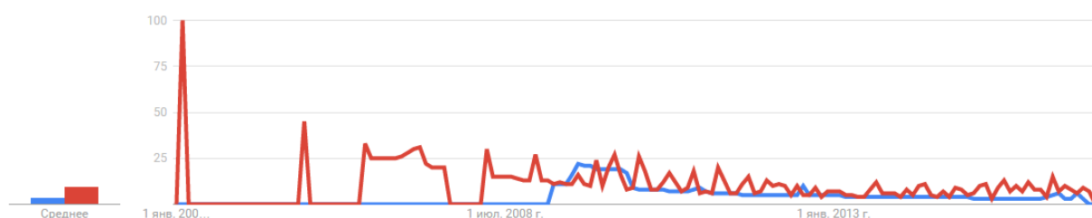
Рис. 2. Соотношение запросов обучение заработку в сети и биржа для начинающих. (заработок в сети – синий, биржа для начинающих – красный)

На рисунке 2 наглядно видно, насколько непопулярны запросы по обучению заработку в интернете и по биржевой деятельности для начинающих. Проблема заключается в том, что если говорить о предыдущих запросах, то определить текущие запросы, то их существенно меньше.