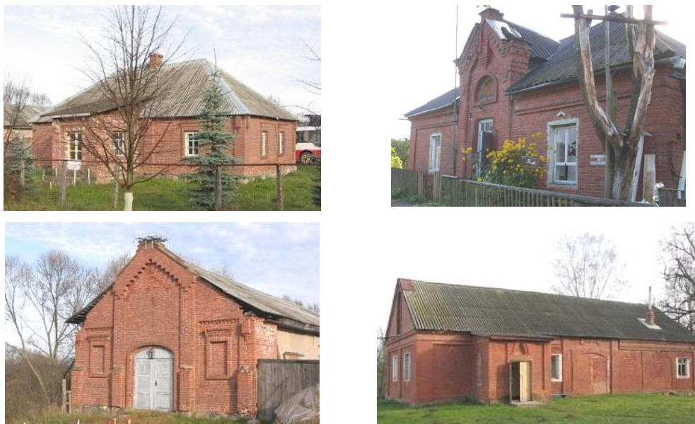
Рис. 3. Хозяйственные постройки

В построении пейзажного сада приветствуется неровный рельеф – возвышенности, склоны, овраги, природные водоёмы и даже болотца. Все природные недостатки местности сглаживаются, а достоинства обыгрываются. Плоский ландшафт требуется изменить искусственно, создать водоем, насыпи или впадины, затушевывая их рукотворность. Архитектурные сооружения в пейзажном парке второстепенны, они должны быть вписаны в пейзаж.