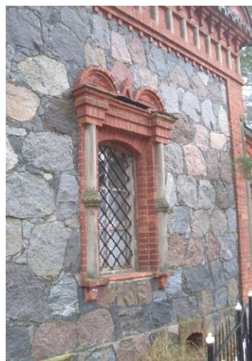
Рис. 6. Вход и оконный проем храма

Необходимо отметить, что А.А. Римский-Корсаков (17.07.1849 – 26.09.1922) оставил после себя на Полоцкой земле добрую память. Кроме построенного садово-усадебного и садово-паркового комплекса и православной Свято-Иверской церкви, на его средства были возведены церковь в деревне Дубровка (разрушена в 1960-е годы) и школа. Был он также почетным опекуном Дубровского народного училища; член Государственного Совета, шталмейстер Высочайшего двора, сенатор, активный деятель патриотического движения в России и эмиграции. Тверской помещик, представитель старинного дворянского рода.