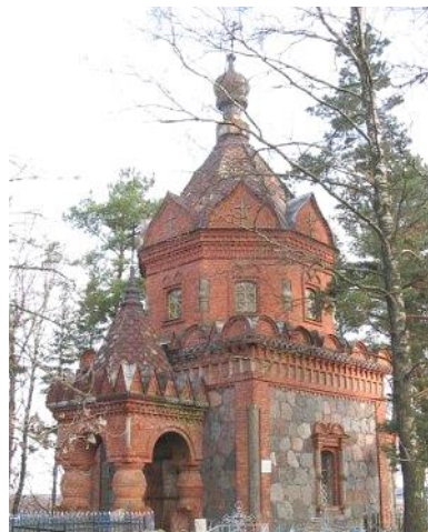
Рис. 5. Свято-Иверская церковь