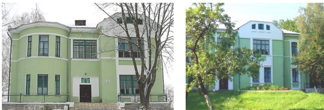
Рис. 2. Главный и южный фасады усадебного дома А.А. Римского-Корсакова

Немалая часть родовых дворцово-парковых и усадебно-парковых комплексов располагается в Витебской области. К ним относится усадьба А.А. Римского-Корсакова, родственника известного композитора Н.А. Римского-Корсакова [5]. Усадебно-парковый комплекс расположен в деревне Бездедовичи Полоцкого района. Сохранился в хорошем состоянии. От первоначальной постройки утрачены только балкон на втором этаже и фонтан. Усадьба создана в начале XX века. Включает усадебный дом, пейзажный парк с системой прудов и хозяйственные постройки. Центром ансамбля является двухэтажный усадебный дом, расположенный на невысоком холме. Дом выстроен из камня, с мощными стенами. По словам его хозяина: «Это для того, чтобы дом сохранился в нашем роду тысячу лет» [5]. Композиция дома основана на использовании разных по форме ризалитов, выступающих из основного объема. Фасады декорированы разными по форме оконными проемами, наличниками и т.п. (рис. 2).