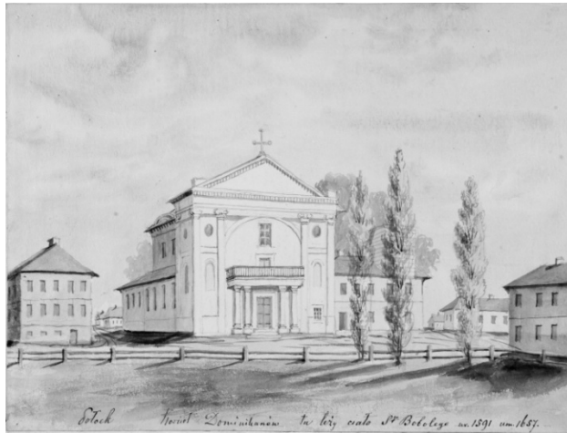
Малюнак 3 – Полацк. Кляштар дамініканцаў

шаўся масіўным фігурным франтонам з арачнымі нішамі, але ў 1804 г. яго замянілі пакатым трохвугольным франтонам на ўсю шырыню збудавання.