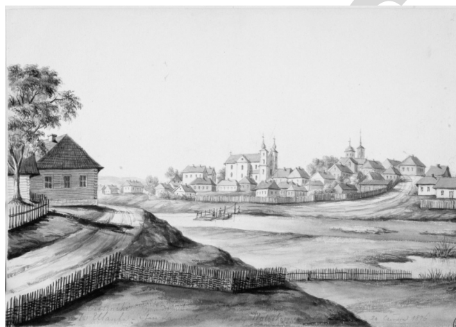
Малюнак 2 – Чашнікі. Панарама мястэчка з касцёлам дамініканцаў

Відавочна, што ў тлумачальным надпісе да малюнка больш увагі Орда надае слаўнай гісторыі тутэйшага замка, але цікавую інфармацыю прадстаўляе таксама выява комплексу дамініканскага кляштара, які на сённяшні дзень не існуе. Касцёл св. Тамаша Аквінскага – трохнефавая базіліка з трансептам, роўнавысокім з цэнтральным нефам, і фасадам-нартэксам з дзвюма чацверыковымі вежамі, увенчанымі вярхамі, што спалучаюць форму шатра-“каўпака” і гранёнага купалка-“банькі”. Тарцы даха трансепта закрыты сціплымі трохвугольнымі франтонамі. Стылістыка святынні мела выразныя рысы сармацкага барока. За алтарнай часткай касцёла размяшчаўся двухпавярховы П-падобны кляштарны корпус, які пасля скасавання кляштара ў 1832 г. нейкі час выкарыстоўваўся як шпіталь. Справа ад касцёла дамініканцаў на малюнку прадстаўлена драўляная праваслаўная Мікалаеўская царква, якая складалася з чатырох зрубаў, што ўтваралі ў плане роўнаканцавы грэчаскі крыж. Гэтая кампазіцыя драўляных храмаў была вельмі распаўсюджана ў рэгіёне Верхняга Падняпроўя і Падзвіння ў XVII–XVIII стст. Над галоўным уваходам узвышалася трох’ярусная вежа-званіца.