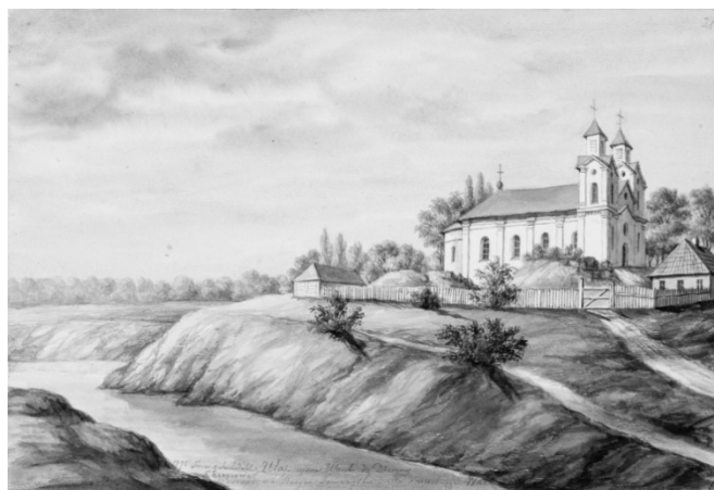
Малюнак 1 – Ула. Панарама мястэчка з касцёлам дамініканцаў

Маскоўскіх у 1580 г., ідучы на Вялікія Лукі. – На замчышчы стаіць касцёл і кляштар айцоў дамініканцаў, пабудаваны Жыгімонтам Слушкам, Харунжым Літоўскім ў 1674 г.” (па іншых крыніцах Адамам Слушкам – Т. Г.).