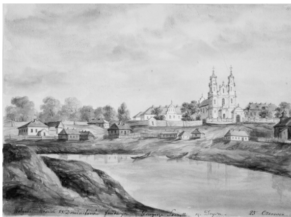
Малюнак 4 – Валынцы. Панарама мястэчка з касцёлам дамініканцаў

валют з грабеньчыкамі, дэкаратыўных вазонаў. Бакавыя алтары выкананы “штукатарам з Вільні”, асвечаны ў 1759 г., а галоўны алтар завершаны і асвечаны толькі ў 1766 г. Аздаба інтэр’ера мела стылістычныя прыкметы ракако.