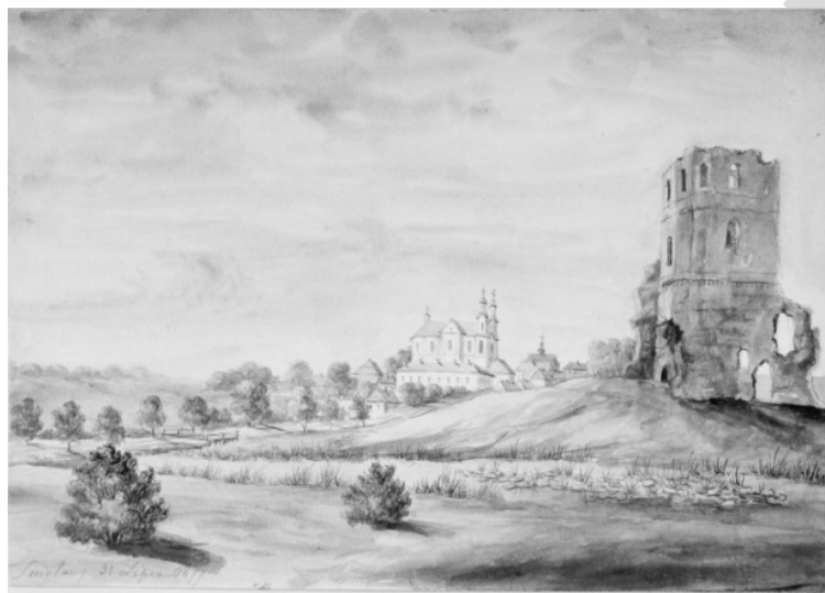
Малюнак 8 – Смаляны. Панарама мястэчка з касцёлам дамініканцаў

На наступны дзень, 31 ліпеня 1877 г., Н. Орда быў ужо ў Аршанскім павеце, непадалёку ад Сянно, і зрабіў замалёўку мястэчка Смаляны з боку рэчкі Дзярноўкі [1, № 666]. На малюнку (мал. 8), зробленым, як звычайна, алоўкам і злёгку падмаляваным акварэллю, справа прадстаўлены руіны вежы замка, пабудаванага ў стылі паўночнага рэнесанса каля 1626 г. князем С. Сангушкам-Ковельскім (у Кракаўскім каталозе малюнкаў Н. Орды ён недакладна атрыбутаваны як замак каралевы Боны – Т. Г.). У цэнтры бачны прыгожы касцёл з двюма стромкімі вежамі ў стылі віленскага барока, у далечыні справа ад яго – драўляная Спаса-Праабражэнская царква XVIII ст., злева – высокі грувазкі ламаны дах сінагогі. Касцёл Звеставання Дзевы Марыі належаў вельмі пашыранаму на Беларусі жабрацкаму прапаведніцкаму ордэну дамініканцаў, які з’явіўся тут у 1678 г. па запрашэнню тагачаснага ўладальніка мястэчка князя Гераніма Сангушкі [8, спр. 1977]. Прыгожая мураваная трохнефавая базіліка з трансептам, які выяўлены толькі ў верхнім сячэнні збудавання, узведзена самімі манахамі-дамініканцамі пад кіраўніцтвам Людвіка Грынцэвіча, які, як вядома, навучаўся архітэктуры ў Італіі. Лацінскі крыж, утвораны дахамі цэнтральнага нефа і трансепта, падкрэслены фігурнымі франтонамі на галоўным і бакавых фасадах. Кляштар зачынены пасля паўстання, у 1832 г., святыня больш за стагоддзе знаходзіцца ў заняпадзе і паступова разбураецца.