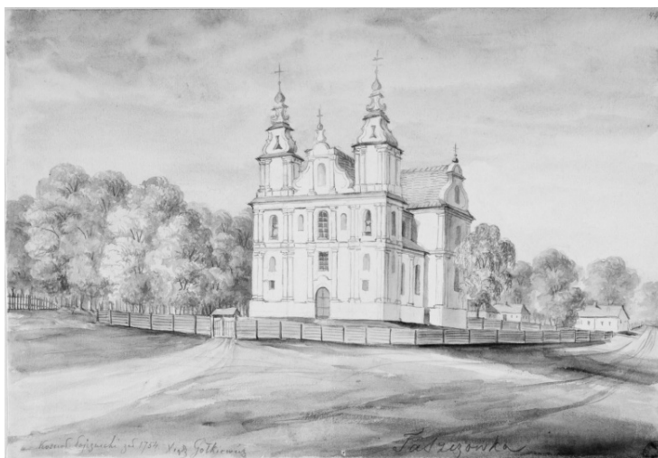
Малюнак 6 – Фашчаўка. Касцёл езуітаў

бярвенняў “у шулах” са сціплай брамкай-“веснічкай”, што падкрэслівае незвычайнасць размешчэння місіі гэтага арыстакратычнага ордэна ў глыбокай правінцыі. З 1876 г. касцёл стаў парафіяльным і набажэнствы ў ім вяліся на беларускай мове. Разбураны ў 1930-я гг., на сённяшні дзень ад яго не засталася ніякіх слядоў.