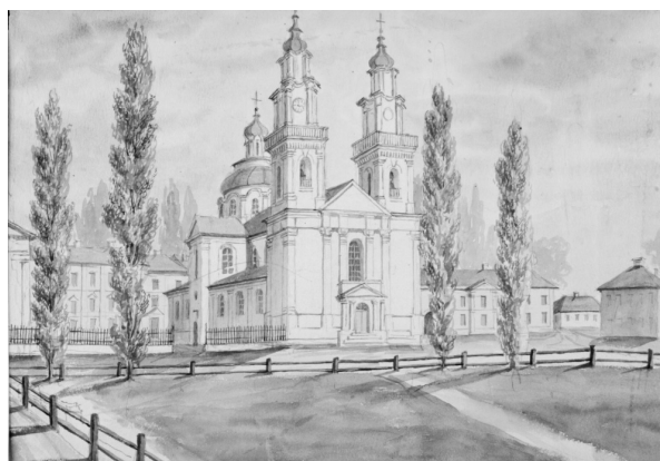
Малюнак 5 – Полацк. Касцёл езуітаў

Фатальны гістарычны лёс дамініканскіх святынь найбольш яскрава выяўляе каштоўнасць архітэктурных замалёвак Н. Орды як захавальнікаў гістарычнай памяці нашага народа, яго духоўнай культуры. Але не менш пацярпелі і святыні іншых каталіцкіх ордэнаў. Значную ўвагу ў сваіх замалёўках Н. Орда надаў таксама святыням ордэна езуітаў. На малюнку (мал. 5), выкананым 28 чэрвеня 1875–1876 гг. [1, № 564; 7, с.9], касцёл езуітаў у Полацку прадстаўлены надзвычай цёпла і аб’ёмна, у больш выразным ракурсе параўнальна з пазнейшымі фотаздымкамі, з адлюстраваннем мяккай хвалістай пластыкі купала і верхніх ярусаў вежаў у стылі віленскага барока. “Парадная” плошча перад касцёлам прадстаўлена больш падобнай на сядзібны пляц, акружаны дрэвамі.