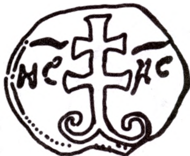
Пячатка № 325 па В.Л.Яніну. Прамалёўка.