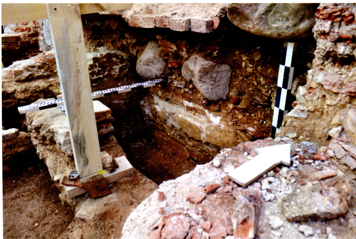
Аркасолій на паўднёвым фасадзе Спаса-Праабражэнскай царквы з саркафагам, у якім была знойдзена пячатка Еўфрасіні Полацкай.