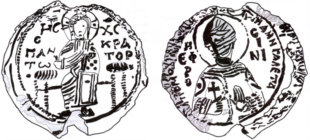
Парадная пячатка Еўфрасінні Полацкай. Прамалёўка. Аверс і рэверс.

(злева) і Х/С (справа). Адметным з'яўляецца памылковае напісанне першай часткі манаграмы, дзе замест агульнапрынятай літары І — выбіта "И". (Выключэннем у сфрагістычным матэрыяле таго часу з'яўляецца, бадай што, толькі пячатка, згаданая расійскім даследчыкам В.Л.Яніным пад нумарам 325 3 , якая належала прадстаўніку наўгародскай княжацкай адміністрацыі і з аднаго боку змяшчае выяву пакутніка Фёдара, а з другога — квітнеючага крыжа. Злева ад крыжа мы бачым манаграму Хрыста з літарай "И".) Каля выявы — змешчана легенда — слова Панткратор — "Пантакратар" ("Усеўладны"), злева — |Пан|тw і справа — |кра|тор. Вакол выявы ідзе арнамент, які вызначае граніцу пячаткі. Злева ён кропкавы, а справа зліваецца ў лінію.