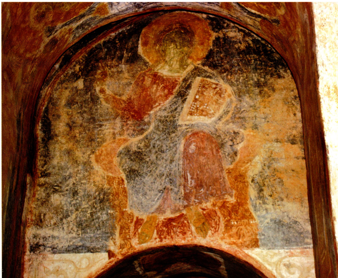
Фрэска з выявай Хрыста Пантакратара.