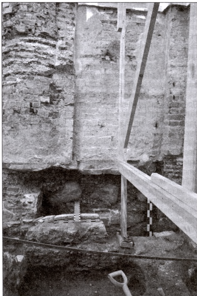
Аркасолій Спаса-Праабражэнскай царквы на паўднёвым фасадзе падчас раскопак у 2017 г.

Яшчэ адзін саркафаг быў выяўлены пры вывучэнні другога з захаду прасла паўднёвага фасада храма. Гэтая частка сцяны ўнізе была сур'ёзна пашкоджаная і адрамантаваная ў XIX ст. Цяпер тут можна бачыць кладку з брусковай цэглы на вапнава-пясчаным раствору. Гэтая позняя закладка абапіраецца на шэраг валуноў, які залягаў у пераадкладзеным пласце будаўнічага смецця. Пасля выбаркі гэтага пласта было выяўлена, што ніжэй за ўзровень валуноў старажытная кладка сцяны была счасаная на глыбіню да 30 см. Счасанымі быў і ўсходні бок заходняй лапаткі з паўкалонай прасла фасада, а ва ўсходняй лапатцы і сцяне галерэі, што далучаецца да яе, было зроблена паўкруглае паглыбленне. Гэтая ніша з боку інтэр'ера была аддзеленая сцяной, складзенай з вузкай плінфы (24x18x3,5 см). Абмежаваная гэтай сцяной прастора ўяўляла сабой саркафаг, сцены якога былі пакрытыя пластом вапнава-цамянкавай тынкоўкі. Дно саркафага было закладзенае плінфай на раствору з цамянкай, пакладзенай на валуны падмурка храма.