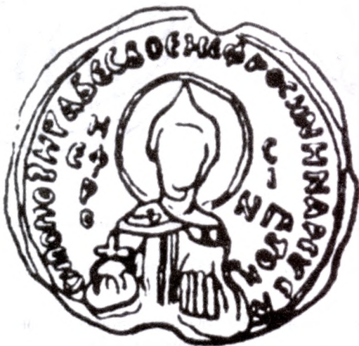
Пячатка Еўфрасінні Галіцкай. Прамалёўка.