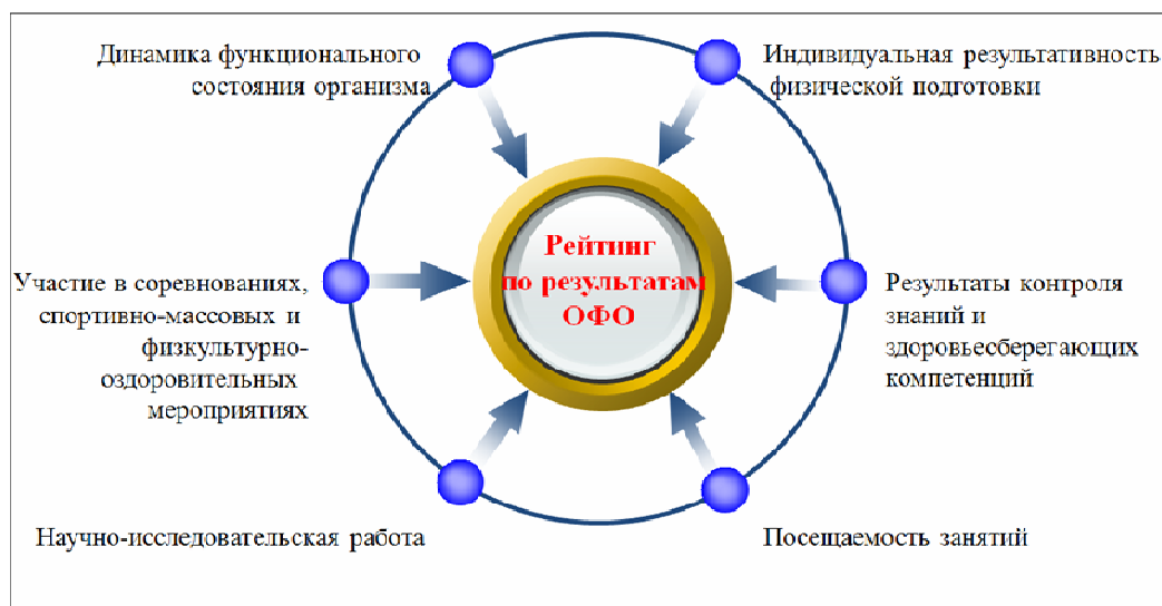
Рисунок 1. – Структура рейтинговой оценки результатов ОФО студентов

Как показано ранее, рейтинг по результатам ОФО складывается из ряда компонентов: индивидуальной результативности физической подготовки 1 и динамики функционального состояния организма, результатов текущего контроля знаний и здоровьесберегающих компетенций, участия в соревнованиях 2 , спортивно-массовых и физкультурно-оздоровительных мероприятиях, научно-исследовательской работы, а также посещаемости занятий (Рисунок 1).