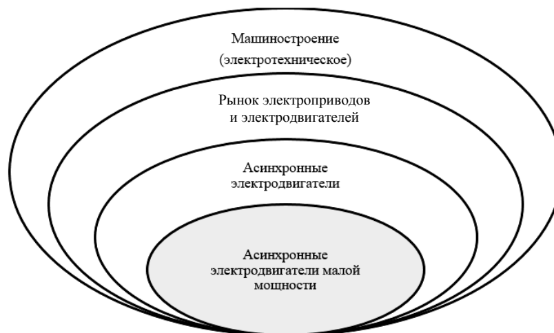
Рисунок 2. – Субрынок, в рамках которого действует Завод НОДВИГ

Завод НОДВИГ действует в отрасли машиностроения (электротехническое). В рамках отрасли работает на рынке электроприводов и электродвигателей, который можно разделить на субрынки. Исследование показало, что данная организация сфокусирована на рынке асинхронных электродвигателей. Анализ данного рынка свидетельствует о том, что организация работает на субрынке асинхронных электродвигателей малой мощности, в рамках которого производит однофазные и трехфазные электродвигатели, которые, в свою очередь, могут быть общепромышленными и специального назначения. Субрынок производимой предприятием продукции в рамках отрасли графически представлен на рисунке 2.