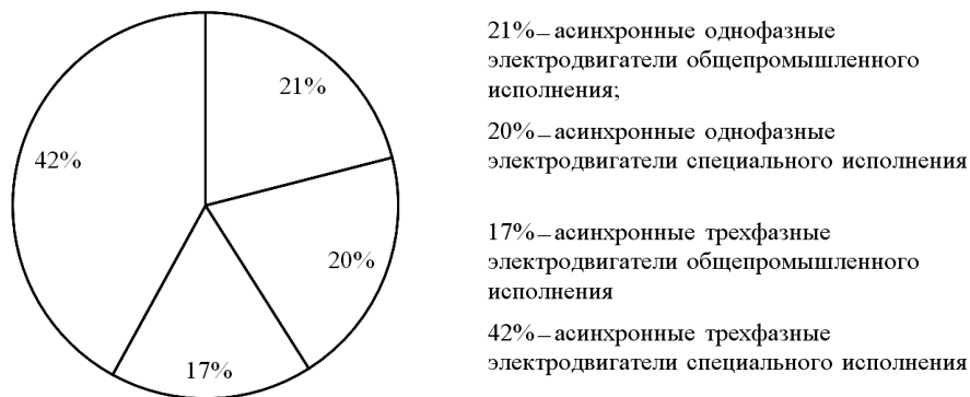
Рисунок 3. – Структура реализации электродвигателей различного назначения в общем объеме продаж Завода НОДВИГ, 2016 год

Ассортиментный ряд Завода НОДВИГ насчитывает порядка 30 позиций. Их анализ показал, что в рамках используемых технологий, имеющихся основных производственных фондов и сегмента электродвигателей малой мощности, в котором работает предприятие, Завод НОДВИГ производит весь возможный ассортиментный ряд продуктов. На рисунке 3 представлена структура производства Завода НОДВИГ в рамках указанного сегмента.