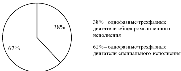
Рисунок 4. – Структура реализации общепромышленных электродвигателей и электродвигателей специального назначения в общем объеме продаж Завода НОДВИГ, 2016 год

Соотношение объема продаж специальных электродвигателей к общепромышленным проиллюстрировано рисунком 4, из которого видно, что в 2016 году производство специальных двигателей преобладает над общепромышленными почти в два раза. Это объясняется тем, что предприятие всегда стремится увеличить производство и продажи именно двигателей специального исполнения, так как у них выше стоимость и в них в большей степени заинтересованы покупатели.