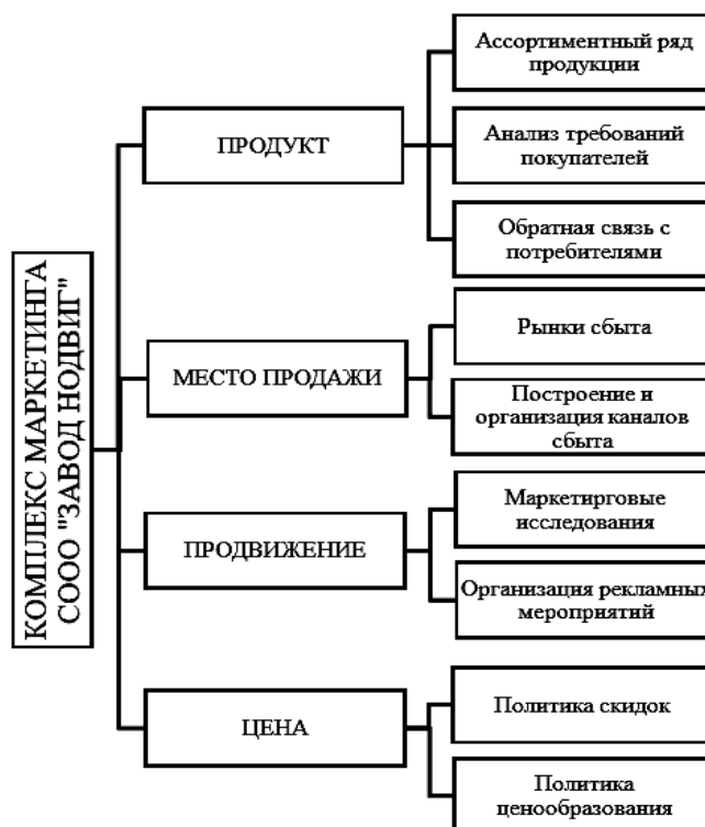
Рисунок 1. – Компоненты маркетинговой политики Завода НОДВИГ

Основная часть. Маркетинговая политика, действующая на Заводе НОДВИГ, может быть продемонстрирована четырьмя основополагающими элементами 4Р, каждый из которых в той или иной степени представлен в маркетинговой политике предприятия. Ключевые компоненты концепции 4Р и их составляющие на Заводе НОДВИГ показаны на рисунке 1.