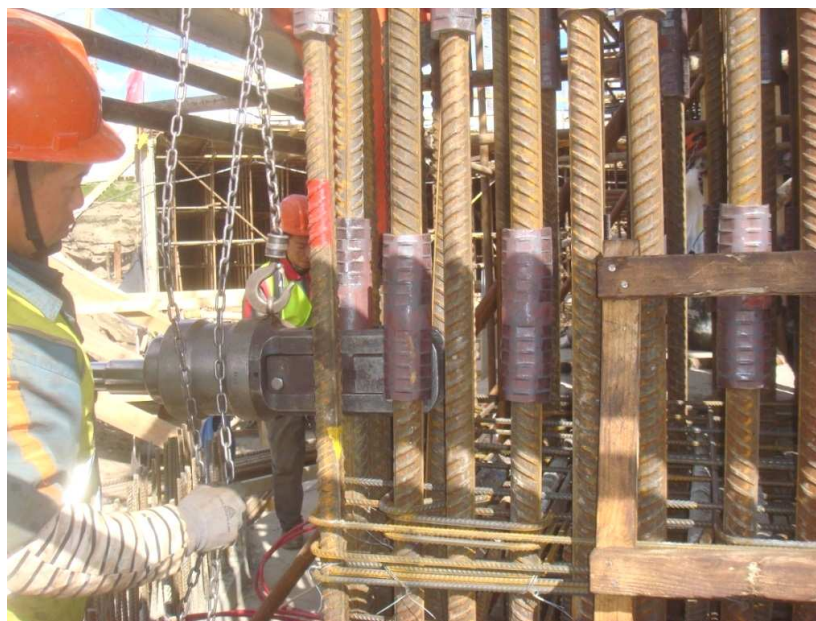
Рисунок 3. – Обжатие соединительной муфты на втором стыкуемом стержне (существующем выпуске арматуры)