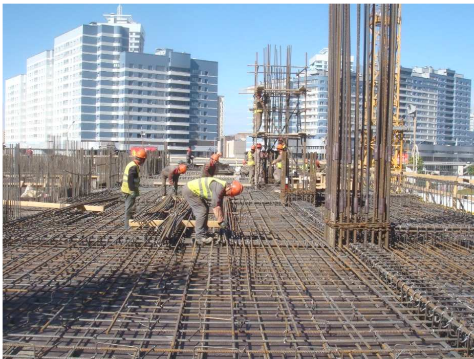
Рисунок 4. – Поэлементный монтаж арматурного каркаса колонны

Немаловажным является и необходимость возведения строительных лесов в месте сборки арматурного каркаса колонны, что также увеличивает продолжительность работ (рисунок 4).