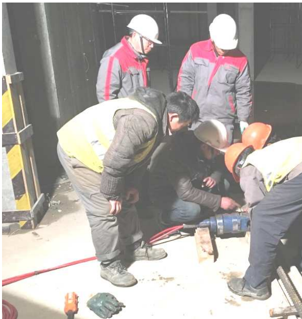
Рисунок 2. – Установка и опрессовка соединительных муфт на стыкуемом стержне

- второй этап – стержень подается к месту сборки арматурного каркаса колонны и стыкуется с выпуском арматуры. После выверки положения арматурного стержня производится окончательное обжатие соединительной муфты в вертикальном положении (рисунок 3).