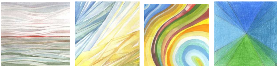
Малюнак 5. – Знак-індэкс “Беларусь”

Як вядома, сучасная архітэктурна Беларусі вызначаецца інтэрнацыянальнасцю, універсальнасцю, пошукамі новых інжынерных тэхналогій і адначасова пошукамі найноўшых сродкаў алюстравання нацыянальных і рэгіянальных рысаў краіны . Сучасныя метады архітэктурнай каларыстыкі, уключаючы багатыя кампазіцыйныя сродкі, выкарыстоўваюцца пры ўвасабленні ў жыццё новых праектаў гарадоў, мікрараёнаў і іншых аб'ектаў, складаючы архітэктурнае асяроддзе. Каб раскрыць фарбамі бачанне ёмістага і тонкага паняцця нацыянальнага каларыту ўжываюцца тэхнічныя прыёмы колеравай графікі, так званыя фармалізаваныя выявы ў выглядзе фарбавых накрасаў, якія ў семантыцы вызначаны як іканічныя знакі, знакі-індэкс і знакі-сімвалы. На малюнку 5 прадстаўлены работы*, прысвечаныя пошуку асацыяцый і вобразаў Беларусі ў колеры.