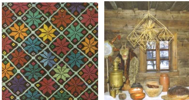
Малюнак 2. – Каляровая палітра ў народнай творчасці

Каларыстыка старадаўняй архітэктуры Беларусі заснавана на колерах асноўных старажытных будаўнічых матэрыялаў – каменя, дрэва, плінфы, цэгля, дахоўкі, якія фарміравалі ў паселішчах і гарадах аблічча пабудовы і агульную каларыстычную прастору.