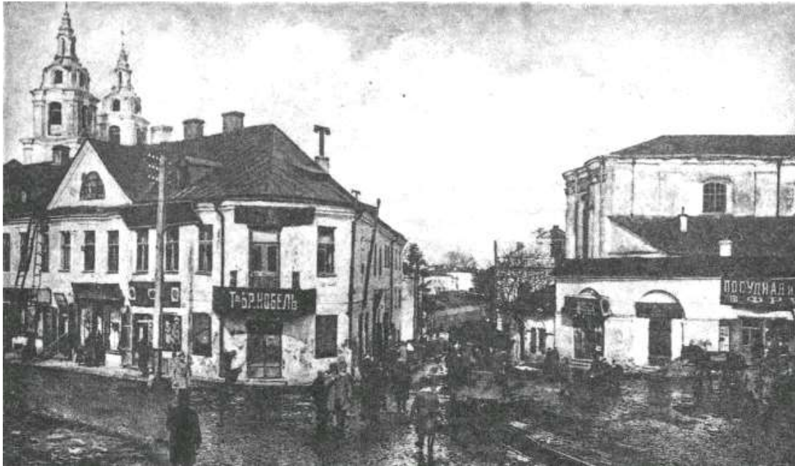
Рис. 3. Улица Маломонастырская. Справа торговые ряды и бывший костел Св. Иосифа [11, с. 162]

В Бресте мужской (основан в 1605 году М. Шишковским, фундатор Казимир Сапега, каменный – 1623) и женский (костел основан в 1624 г., каменный – 1750) бернардинские монастыри размещались на Волинском предместье к юго-западу от города, образуя площадь возле моста через реку Муховец [11, с. 117, 119 – 122, 297, 298; 14, с. 124; 15, с. 40]. Главные фасады храмов располагались рядом через улицу и были повернуты под углом друг к другу. Главный двор мужского монастыря располагался со стороны площади. Двухэтажный незамкнутый монастырский корпус примыкал к пресбитерию костела с северной стороны с отступом от красной линии площади. В восточной части комплекса располагался регулярный сад с хозяйственными постройками. В женском монастыре квадратный в плане замкнутый двор-клуатр с садом образовывал двухэтажный монастырский корпус (1781 г.), со второго этажа имевший выход на хоры храма. В северо-западной части комплекса был устроен второй монастырский двор, на юго-востоке – регулярный сад.