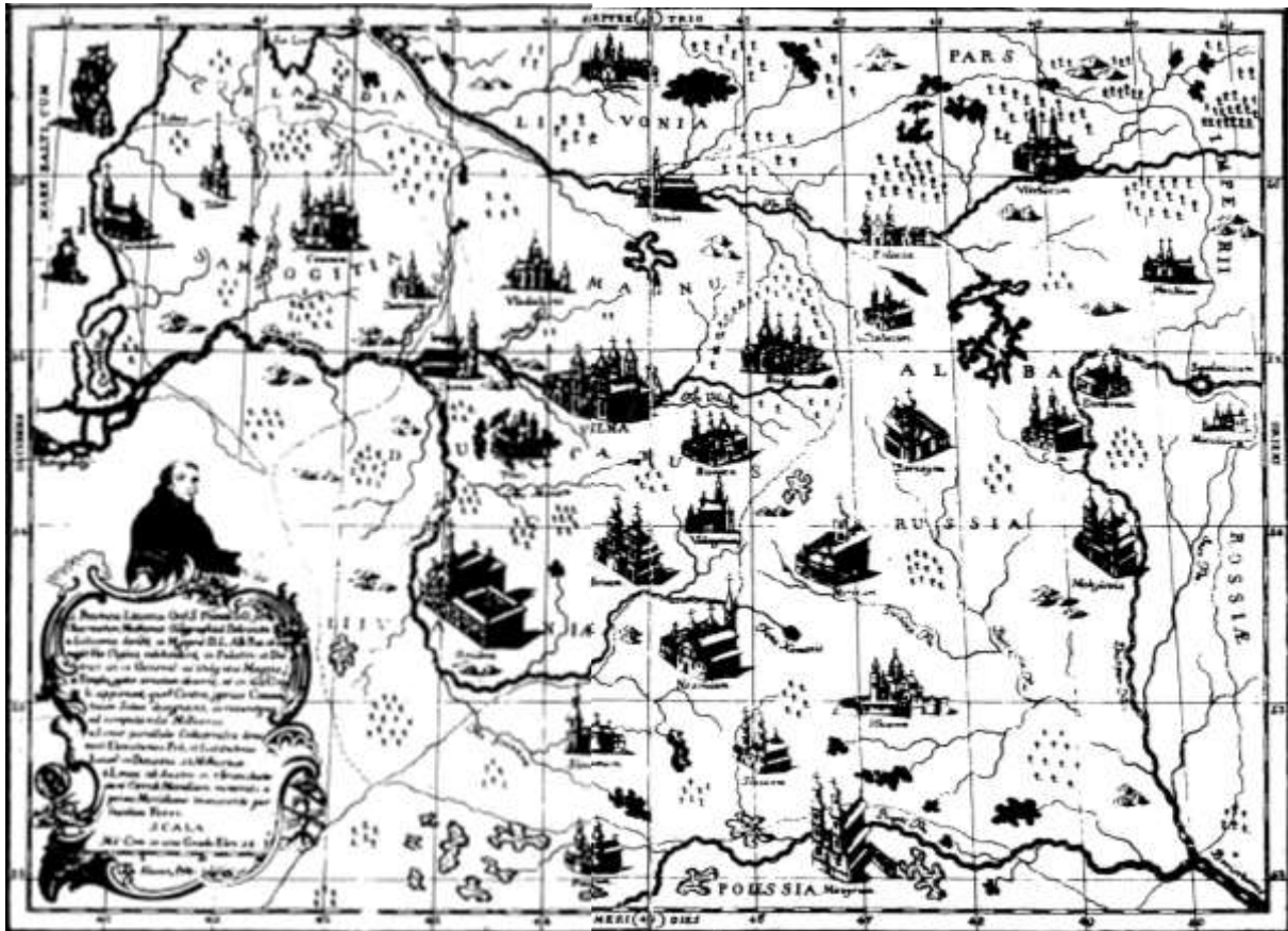
Рис. 1. Распространение бернардинских монастырей в Речи Посполитой [7]

мов, заимствованных из аналогов европейской архитектуры. Компонка монастырей определялась общим функциональным и символическим содержанием данных образований в контексте специфики каждого монашеского ордена.