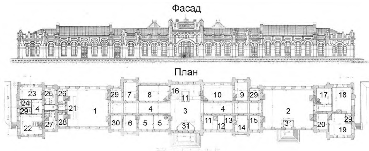
Рисунок 2. Николаевский вокзал в Полоцке. Фасад и план [7, л.58]

В здании Николаевского вокзала в Полоцке имелись следующие помещения: 1. - зал I и II классов; 2. - зал III класса; 3. - вестибюль; 4. - проходы; 5. - контора нач. станции; 6. - кабинет нач. станции; 7. - кабинет дежурного Болог. Полоц. ж. д.; 8. - телеграф Болог. Полоц. ж. д.; 9. - кабинет дежурного Полес. ж. д.; 10. - телеграф Полесских ж. д.; 11. - кассы: билетная и багажная; 12. - батарейная Болог. Полоц. ж. д.; 13. - батарейная Полес. ж. д.; 14. - передаточный агент; 15. - ламповая; 16. - багаж; 17. - кабинет коменданта; 18. - канцелярия коменданта; 19. - почтовое отделение; 20. - жандарм; 21. - буфет; 22. - буфетная кухня; 23. - прислуга; 24. - кладовые; 25. - дамская уборная; 26. - дамская комната; 27. - мужская уборная; 28. - мужская комната; 29. - сени; 30. - сторож; 31. - тамбуры.