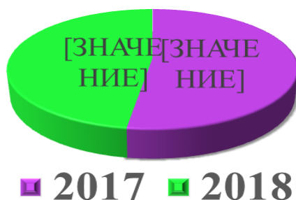
Рис. 1. Статистика преступлений, совершенных несовершеннолетними в год

Сегодня вопрос профилактики преступлений, совершенными несовершеннолетними лицами из года в год приобретает все большую актуальность. Так, по официальным данным Министерства внутренних дел Республики Беларусь в 2018 году за несовершеннолетними было зарегистрировано 1 544 преступления, что на 10,0 % меньше относительно 2017 года (рис. 1) [1].