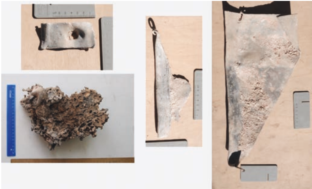
Рис. 4. Детали кровли и оплавки свинца от первоначального покрытия Спасского храма

воздействием внешних факторов природного характера, архитектурный комплекс сильно пострадал и все пристройки к храму были разобраны, очевидно, для вторичного использования кирпича. Окончательному разрушению галерей предшествовал пожар, следы которого хорошо читаются в юго-западной части (раскоп 2), где обнаружены крупные оплавки кровельного свинца с отпечатками угля, куски кровельного покрытия и даже один целый лист (рис. 4), хотя капли свинца найдены везде вокруг храма. Пожар мог спровоцировать дальнейшее постепенное разрушение храма, которое привело к исчезновению галерей. Далее, вокруг храма, на месте галерей начинает существовать кладбище, которое частично было перекрыто отсыпкой при храме и не единожды было потревожено в результате последующей строительной активности представителей ордена иезуитов.