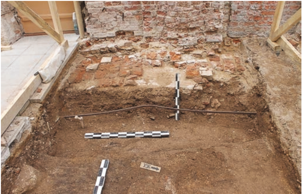
Рис. 2. Фрагмент отмостки XVIII века при южной стене Спасского храма

Д. В. Дука в 2005 г. Исследователем установлена широкая датировка строительства крипт в границах XVIII века [3]. Очевидно, что это было сделано в период одного из ремонтов храма в XVIII веке, о которых есть ряд письменных свидетельств [1]. В раскопе 2017 г., при западном прясле южной стены, было выявлено большое крыльцо для спуска в подземную часть храма. Галерей уже не существовало при его строительстве, при том, что их фундаменты и нижние части стен были полностью разобраны при возведении крыльца. Также, вероятно при возведении указанного крыльца, были выявлены кости из погребений, которые, видимо, перезахоронили рядом, около юго-западной пилястры.