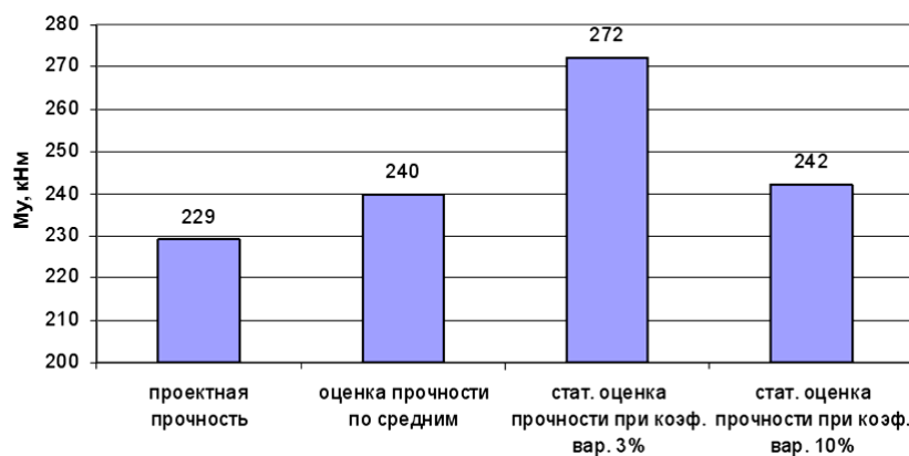
Рис. 1. Сравнение методов оценки прочности

С целью иллюстрации отличий в оценках прочности различными методами расчета можно привести сравнение методов оценки прочности балки на изгиб (рис. 1).