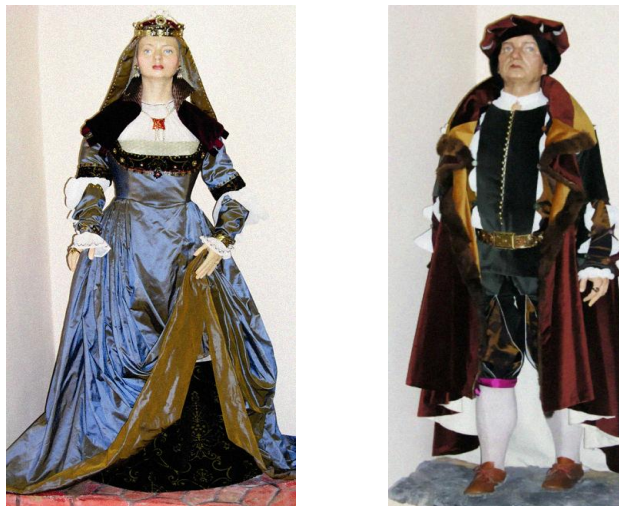
Мал. 4. Мужчынскі і жаночы шляхецкі строй Вялікага княства Літоўскага пачатку XVI ст. Рэканструкцыя Г.А. Барвенавай. Сталая экспазіцыя «Магілёў часоў прыняцця Магдэбургскага права» ў Музеі гісторыі Магілёва