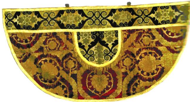
Мал. 3. Капа. Аksamітны бракат. Шаўковыя і залачоныя срэбныя ніткі. Ткацтва, вышыўка. Італія. Канец XV – першая палова XVI ст. Падшыўка: ільняное палатно, тканья галуны. Першая палова XIX ст. Музей Архідэцэзіяльны ў Вільне [27, с. 122]

пасля гэтага экспануюцца як на радзіме, так і за яе межамі. Больш за 30 святарскіх убранняў другой паловы XV – XIX стагоддзя, сотні каштоўных кубкаў, паціраў, цыборыюмаў, пярсцёнкаў і інш., захаваных у ідэальным стане, апавядаюць пра багацце Віленскай катэдры (мал. 3). Многія з экспанатаў захоўваліся ў Археалагічным музеі ў Вільні, з'яўляліся фундушамі Сапегаў, Радзівілаў, іншых магнатаў розным касцёлам і цэрквам Беларусі і Вільні [27].