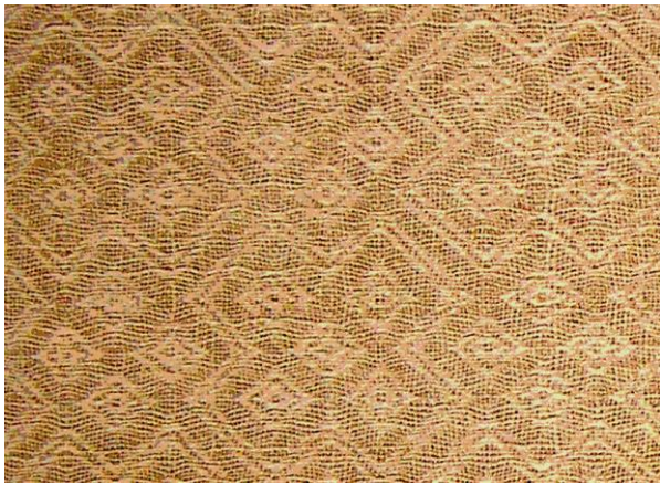
Мал. 1. Тканіна ільняная (адзенне каталіцкага святара). XIV ст. Хэдхайм. Касцёл святога Гадэхарда [25, іл. 41 – 42]

Рэдкімі і каштоўнымі экспанатамі традыцыйнага ткацтва з'яўляюцца тэкстыльныя творы, якія былі сабраны краязнаўцамі ў канцы XIX – пачатку XX стагоддзя [20]. Сярод унікальных музейных збораў – калекцыя Віцебскага абласнога краязнаўчага музея, у якой ілюструецца варыятыўнасць ткацкага рамяства пэўнага рэгіёну, аднаго пакалення, адной майстрыхі. Фрагменты тканін, сабраных у 1925 – 1926 гадах у Гарадоцкім раёне, апавядаюць пра ўзорнае ткацтва, тыпы пляцення, кручэння ніткі, спосабы апрацоўкі палатна і яго афарбоўкі. Узоры рознаварыянтных тканін, радзей з вышыўкай, збіраліся вучнямі ў сем'ях і перадаваліся настаўніку-краязнаўцу. Прынесеныя кожным вучнем тканіны (звычайна па 7 – 10 фрагментаў) замацоўваліся на картон. Вось прыклад подпісу да аднаго з картонаў: «Ткані па вёсках Гарадоцкага р-на, в. Хобнішча Мішневіцкага с/с. Сабраны вучнем IV класа Я. Зуевым, работа яго маці Я. Логінавай». Тканіны на картонах вызначаюцца якасцю і каларытам, сведчаць пра індывідуальнасць і густ майстрых, прычым рэдкія тканіны, выкананыя ў суседніх вёсках, ідэнтычныя. Калекцыя сведчыць, што тэхналогія вырабу тканін перадавалася праз стагоддзі – тыпы палатнянага, саржавага, ламанага саржавага пляценняў маюць аналогіі з тканінамі XII стагоддзя, тканіны валеныя з воўны, узоры складанага саржавага пляцення аналагічныя тканінам канца XV стагоддзя (мал. 1, 2).