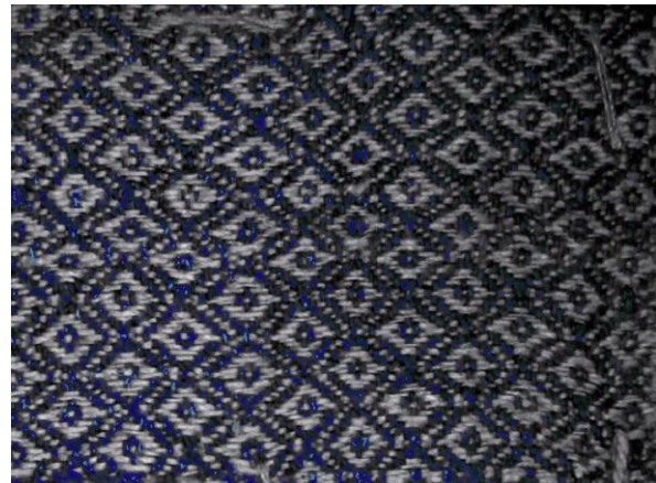
Мал. 2. Тканіна ільняная. 1925 г., в. Хобні Пальмінскага с/с Гарадоцкага р-на. Віцебскі абласны краязнаўчы музей

У другую па колькасці групу экспанатаў мастацкага ткацтва (пасля твораў народнага мастацтва) уваходзіць тэкстыль X – XIX стагоддзяў. Еўрапейскія музеі найчасцей экспануюць мастацкі тэкстыль, які стагоддзямі захоўваўся ў касцельных скарбніцах, у замкавых і палацавых калекцыях. Сёння закрыстыя многіх касцёлаў з рэліквіямі храмаў і парафій даступныя наведвальнікам [23, с. 9; 28]. Напрыклад, у закрыстым Сабора парыжскай Маці Божай захоўваецца кашуля караля Святога Луі (1214 – 1226 – 1270), у якой ён каўся перад алтаром храма за грахі, а таксама арнаты і галаўныя ўборы святароў эпохі Сярэднявечча, Барока, Ракако, арнаты і альбы пап і кардыналаў XX стагоддзя, прычым кожны з гэтых тэкстыльных твораў – узор мастацтва сваёй эпохі. Музейныя тэкстыльныя калекцыі і сёння ўзбагачаюцца высокамастацкімі і сімвалічнымі дарункамі. Напрыклад, музею на Вавелі, папа Ян Павел II ахвяраваў кампаненты свайго ўбрання. Гэтыя высокамастацкія тэкстыльныя творы пачатку XXI стагоддзя дадалі пашаны і святасці храма, кляштара. Закрыстыя буйных касцёлаў Беларусі ў канцы XIX – пачатку XX стагоддзя таксама выконвалі ролю музеяў, там выстаўляліся не толькі культывыя рэчы (рэліквіі, святочнае ўбранне святароў, культывы посуд), але і археалагічныя знаходкі, партрэты і інш. Своечасова і надзейна схаваныя ў 1939 годзе храмавыя калекцыі ў апошнія дзесяцігоддзі адкрываюцца, вывучаюцца навукоўцамі, каталагізуюцца і