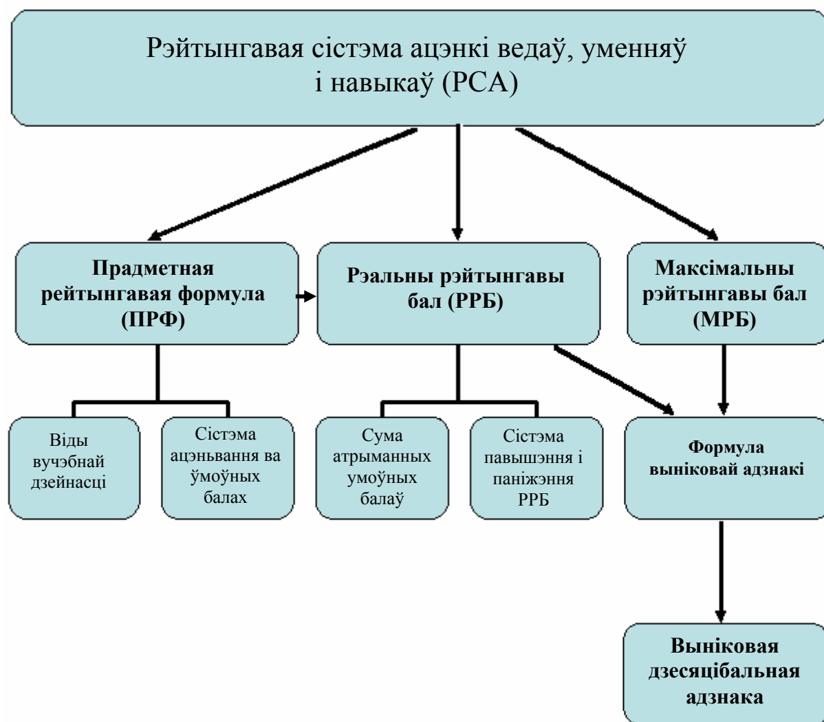
Схема 1. Структурная схема рэйтынгавай сістэмы

Для хутчэйшага засваення і эфектыўнага ўжывання рэйтынгавай сістэмы неабходна ведаць яе лагічную структуру, утрыманне і ўзаемасувязь структурных элементаў. У самых агульных рысах структуру рэйтынгавай сістэмы можна прадставіць у выглядзе схемы (гл. схему 1).