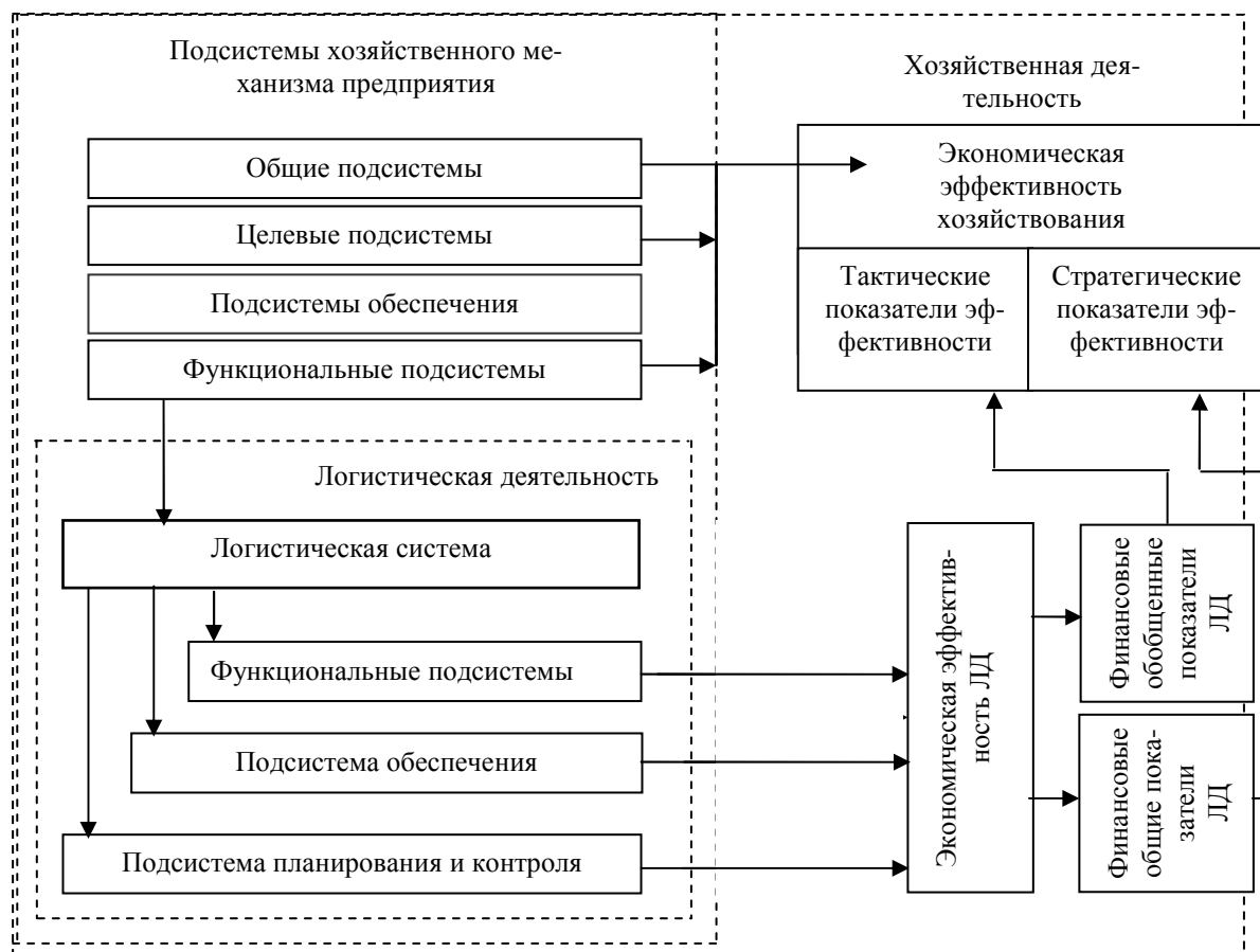
Рис. 1. Гипотетические связи между эффективностью логистической и хозяйственной деятельностью предприятия

Логистическая система, продуцирующая ЛД на предприятии, является одной из подсистем его хозяйственного механизма, который, как известно, состоит из комплекса подсистем: общей, целевых, обеспечения и функциональных [13, с. 251]. Именно к функциональным и принадлежит логистическая система предприятия, каждая из подсистем которой направлена на получение позитивного результата в обслуживании потребителей. Уровень достижения логистической системой плановых показателей оценивается результатом ее функционирования, который гипотетически влияет на экономическую эффективность ЛД предприятия. Ее оценка, безусловно, должна базироваться на основе определения финансовых обобщенных и общих показателей. По мнению автора, именно такого типа показатели могут быть использованы в общих оценках экономической эффективности хозяйствования предприятия на тактическом и стратегическом уровнях. Чем выше будут иметь значения финансовые обобщенные и общие показатели оценки эффективности ЛД, тем эффективнее будет хозяйственная деятельность предприятия. Эти рассуждения могут быть приняты в качестве обоснования того, что ЛД является не только составляющей хозяйственной деятельности предприятия, но и весьма значительно влияет на уровень ее финансового результата.