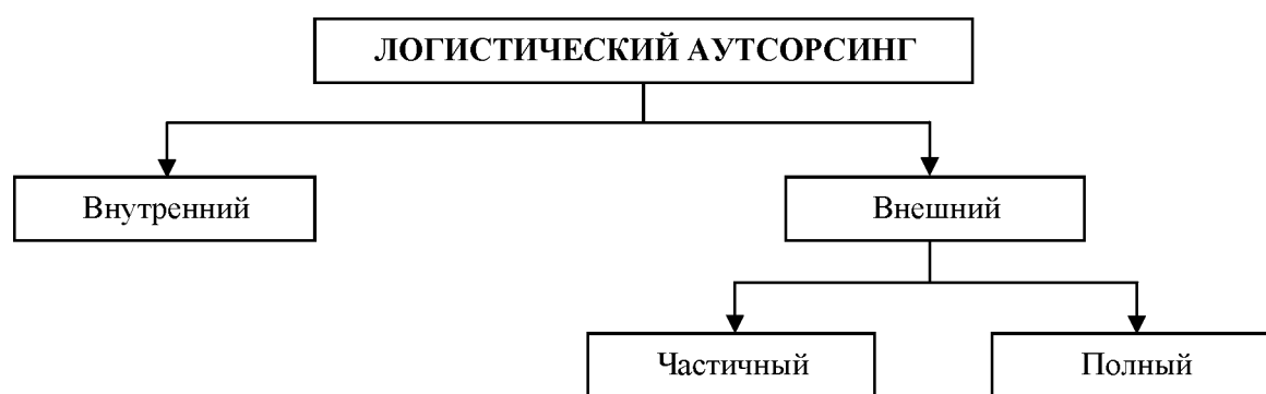
Рис. 2. Формы логистического аутсорсинга

Развитие логистического аутсорсинга находится в прямой зависимости от наличия адекватного предложения на рынке логистических услуг. Кроме того, многие организации не отказываются от выполнения собственными силами отдельных логистических функций, так как уже располагают необходимым складским хозяйством, транспортом и т.п. Выделение в общей сумме затрат организации составляющей логистических затрат, становится первым шагом на пути к использованию логистического аутсорсинга. Поэтому следует выделить формы логистического аутсорсинга (рис. 2).