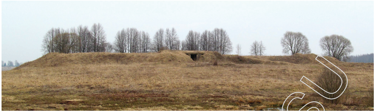
Рис. 2. Вид на площадку Головчинского замка с запада

Теперь попробуем выяснить, сколько раз и когда горел Головчинский замок.