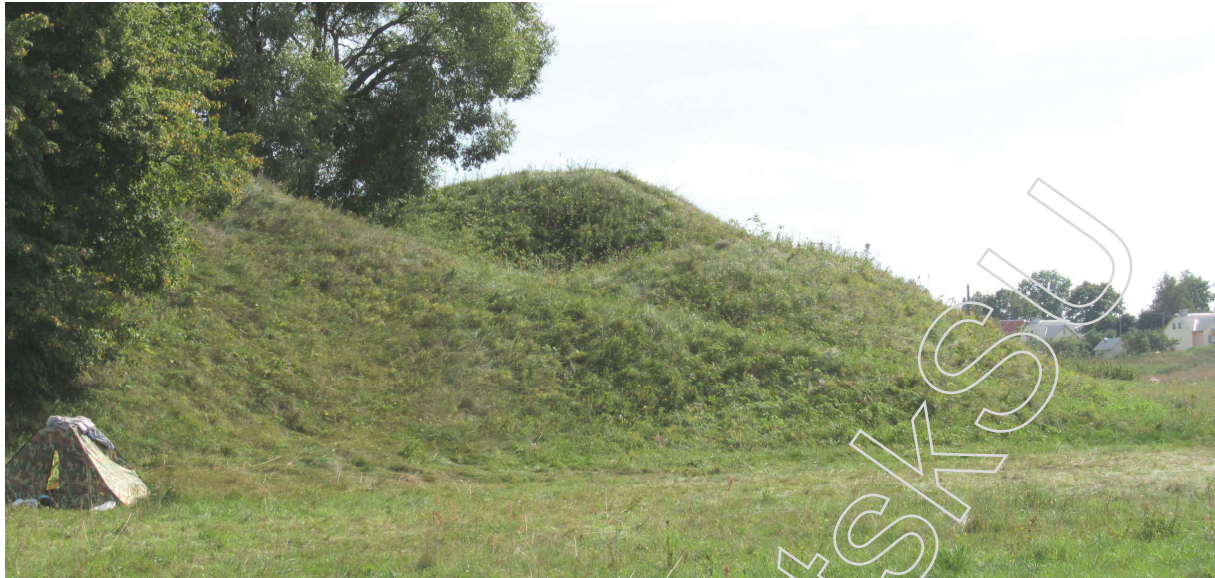
Рис. 3. Пониженный выступ с северной стороны замчища

Опираясь на полученные в ходе раскопок материалы, мы можем с уверенностью согласиться с первым выводом А.В. Салопонова и опровергнуть второй хотя бы потому, что навряд ли панскую усадьбу или, тем более, городище будут окружать бастионоподобными «выводами», которые отчетливо выступают с южной и западной сторон замковой площадки.