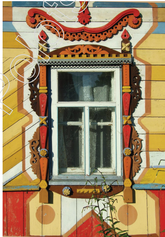
Мал. 5. Вакно ў в. Чарэя Чашніцкага раёну. Экспедыцыя 2008 г.

Што тычына разьбы, то традыцыйныя матывы сёння папаўняюцца новымі сюжэтамі, звычайна абстрактнага або гаспадарча-побытавага характару. Сустрэкаюцца таксама элементы савецкай сімволікі, як напрыклад, у цэнтры сандрыка лішты дома ў в. Канстанцінава Мядзельскага раёна.