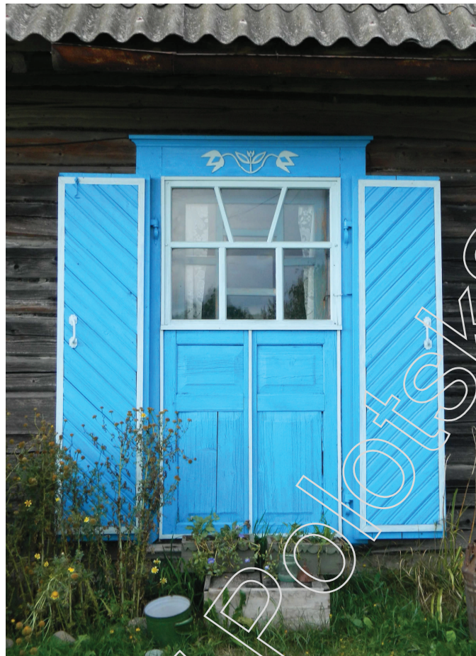
Мал. 2. Фрагмент хаты ў в. Нябышына Докшыцкага раёна. Экспедыцыя 2012 г.

Вокны развіліся ў вясковым дойлідстве з вентыляцыйна-светлавой адтуліны. Пасля далучэння да яе драўлянай засаўкі ўзнікла валакавое акно. Яго наступнік – сучаснае акно – з’яўляецца на мяжы XIII – XIV стст., і складаецца з каробкі (шэфляда), якая акаймоўвае прарублены ў сцяне ваконны праём з рамай на тры-чатыры-шэсць шыбак (балонак), падваконнікам і ліштвямі, што прыкрываюць асадачныя пазы [9, с. 17]. Паводле класіфікацыі Івана Хілько ліштвы бываюць простакутныя, простакутныя з падваконным дэкорам, сандрыкавыя, сандрыкавыя надбудаваныя, франтонападобныя [3, с. 101]. Адрозненні ў абрысах ліштваў на тэрыторыі разглядаемага рэгіёна прыведзеныя ў тэксце вышэй.