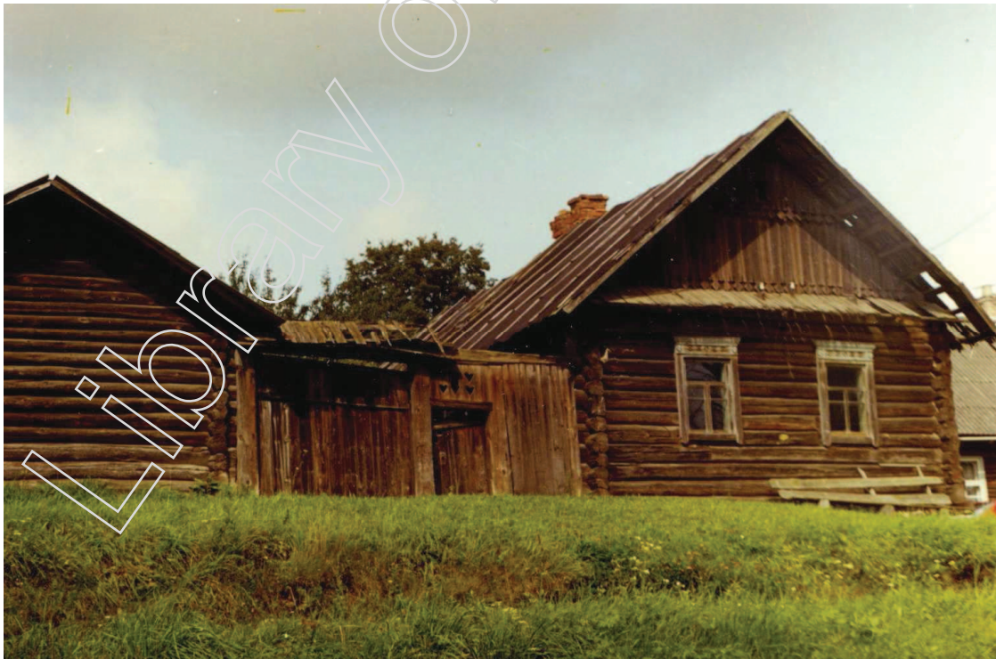
Мал. 1. Вяночны двор у Лепельскім раёне. Экспедыцыя 1998 г.