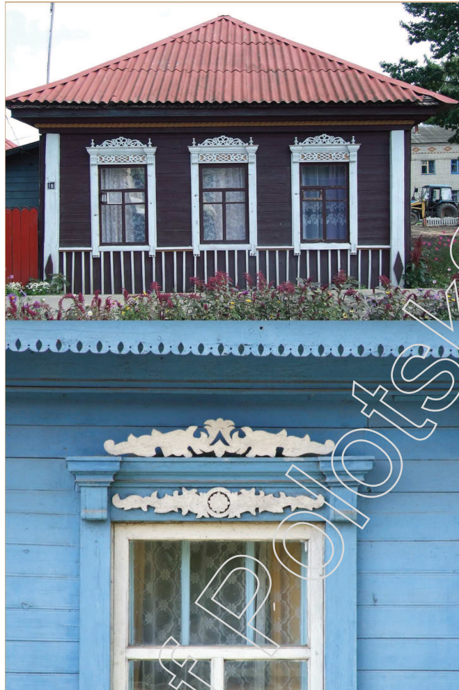
Мал. 3. Вокны ў Чашніках. Экспедыцыя 2008 г.

На франтоне некалькіх хат у в. Нябышына Докшыцкага раёна частка разьбы ўяўляе з сябе выяву дзвюх птушак, якія ляцяць насустрач адна адной, і адасобленая ад даволі сціплай працакутнай з фігурным нізам ліштвы. Такія ўзоры сведчаць пра павелічэнне ролі пластычнага дэкару ў аздабленні фасада.