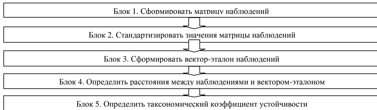
Рис. 4. Алгоритм использования таксономического анализа [8, с. 120]

С помощью современного таксономического подхода, алгоритм которого показан на рис. 4, проведено исследование уровня финансовой безопасности и устойчивости рынка страхования жизни Украины.