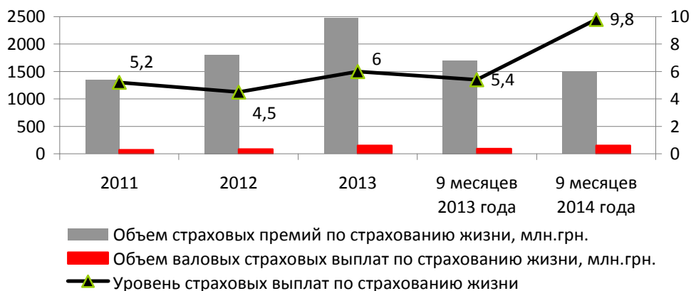
Рис. 1. Динамика страховых премий и страховых выплат по страхованию жизни за 2011 – 9 месяцев 2014 г. [2]

Исследование структуры валовых страховых премий и выплат по страхованию жизни показывает, что наибольшую часть занимает накопительное страхование жизни: в валовых премиях – 48%, в валовых выплатах – 67,7% (рис. 2).