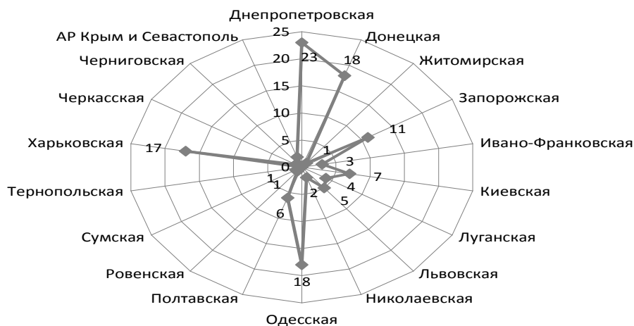
Рис. 3. Количество зарегистрированных СК «Life» по регионам Украины [2]

В Украине по состоянию на начало III квартала 2014 г. зарегистрировано 58 компаний по страхованию жизни (СК «Life»). Несмотря на расширение филиальной сети страховой рынок имеет свои «региональные центры». Менее всего страховых компаний сосредоточено в западной Украине, больше всего – в восточных и центральных регионах, а именно: в Донецкой, Днепропетровской, Харьковской областях и г. Киев (рис. 3). На их долю приходится почти 90% страхового рынка. Можно утверждать, что страховая система в Украине развита в форме высокой степени централизации [2].