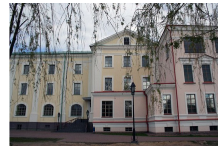
Учебный корпус студентов-историков ПГУ — здание иезуитского колледжиума -академии-кадетского корпуса. Памятник архитектуры XVIII — XIX вв.

Историко-филологический факультет Кафедра отечественной и всеобщей истории