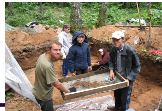
Археологические раскопки, Глубокский р-н.