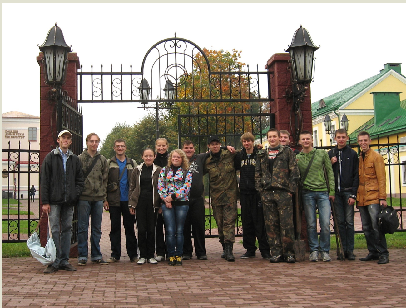
Група валанцёраў перад выправай у археалагічную экспедыцыю