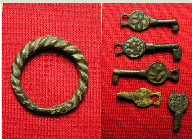
Археалагічныя знаходкі з раскопак у Полацку

За азначаны перыяд супрацоўнікамі Полацкага дзяржаўнага ўніверсітэта абаронены 1 доктарская і 2 кандыдацкія дысертацыі па спецыяльнасці «Археалогія», падрыхтавана 4 магістры гістарычных навук, якія