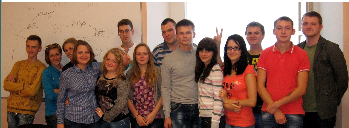
Студэнты-гісторыкі другога курса радуюцца пачатку вучэбнага года :-)