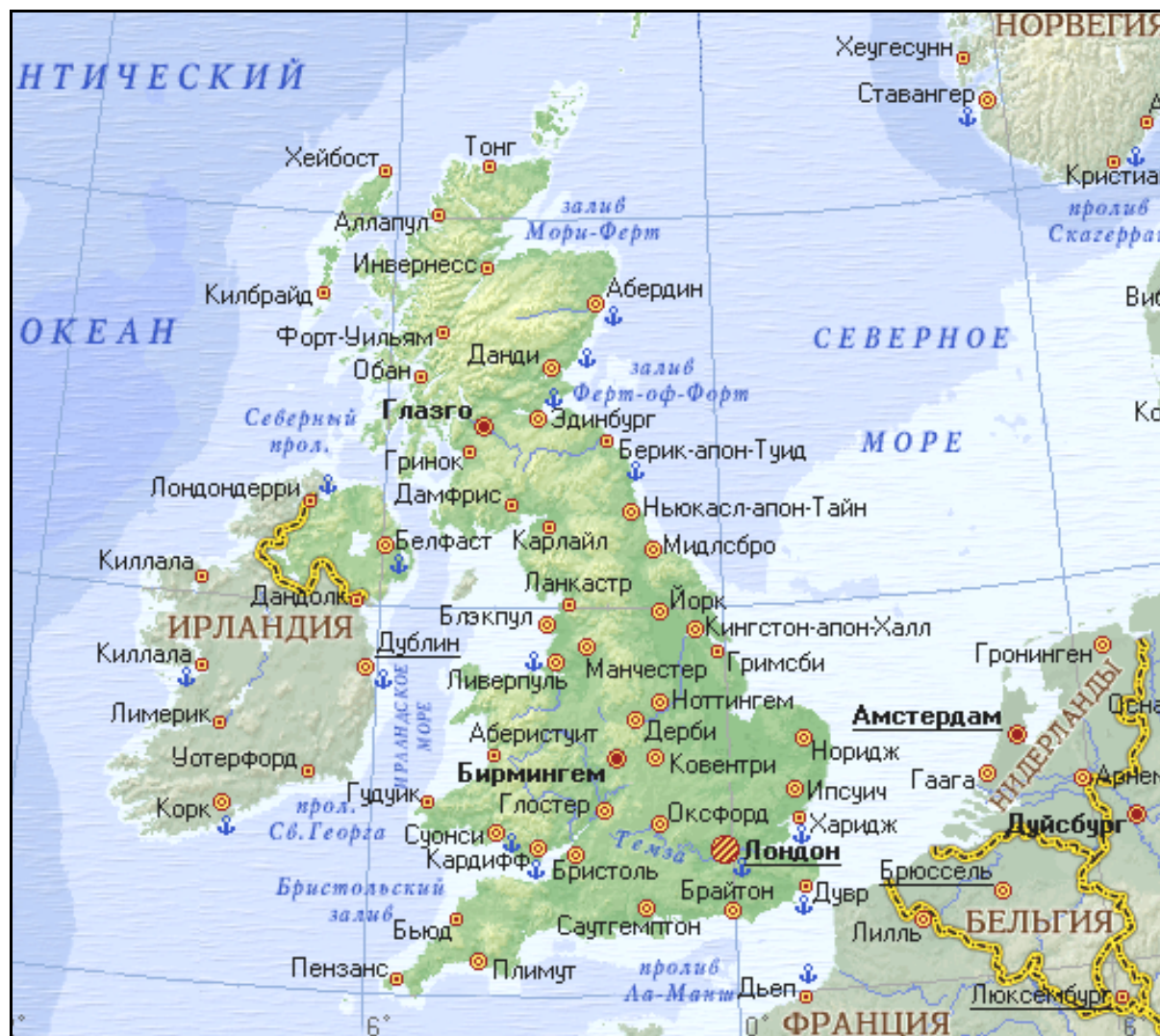
Рис. 3.5. Географическая карта Великобритании

лонии Англии объединены в Содружество – объединение государств, бывших доминионов Великобритании, признающих главой государства английского короля, и ряда иных стран с разными формами правления и имеющих собственную главу государства (Канада, Австралия, Новая Зеландия, Гана, Кения, Шри-Ланка и др.). Отсюда высокая доля во въездном и выездном туризме межрегиональных поездок.