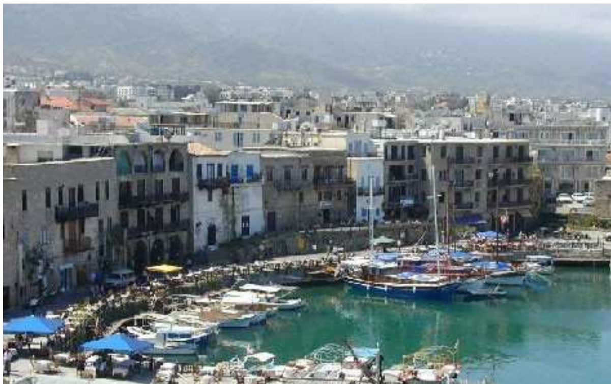
Рис. 3.16. Столица Никосия

Развитие туризма в Республике Кипр характеризуется крайне высокими темпами. В 1991 г. эту страну посетило 1385 тыс. человек, в 1995 г. – 2100 тыс. человек. Основное количество туристов прибывает из Европы – 85% (1996 г.), главным образом самолетом, с целью отдыха. От туризма получено в 1991 г. 1,026 млн долларов, в 1995 г. – 1,783 млн долл., в 1996 г. – 1,670 млн долл.