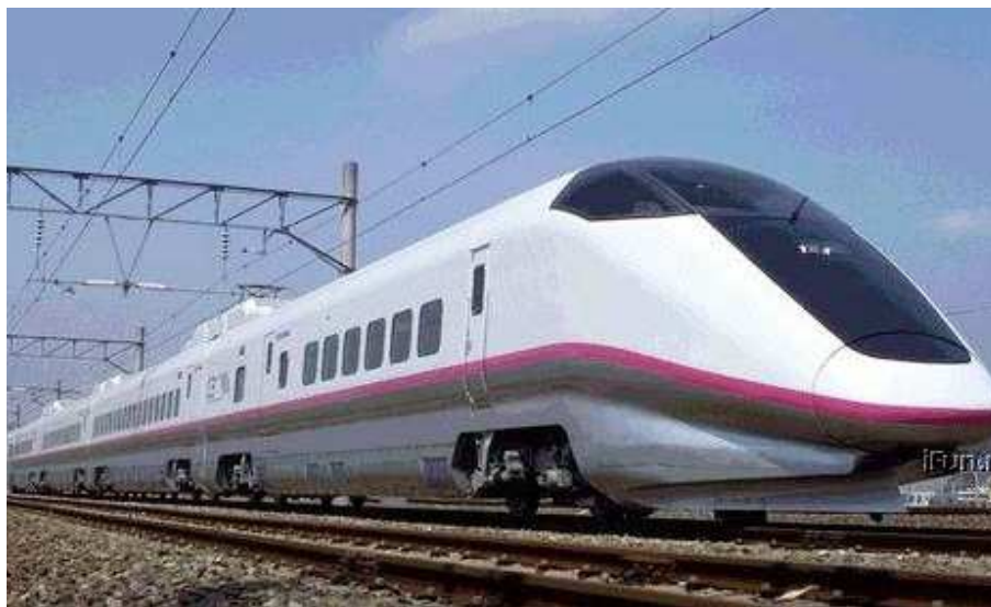
Рис. 1.1. Скоростной суперэкспресс

Благодаря техническому прогрессу созданы условия для организации массовых перевозок пассажиров в Японии, Германии, Франции, Италии и США. Высокоскоростные железные дороги приобретают все большую популярность как наиболее удобный, быстрый и недорогой вид сообщения. По всему миру растет сеть высокоскоростных железнодорожных магистралей. Поезда, следующие по ним, развивают скорость до 300 км/ч (рис. 1.1).