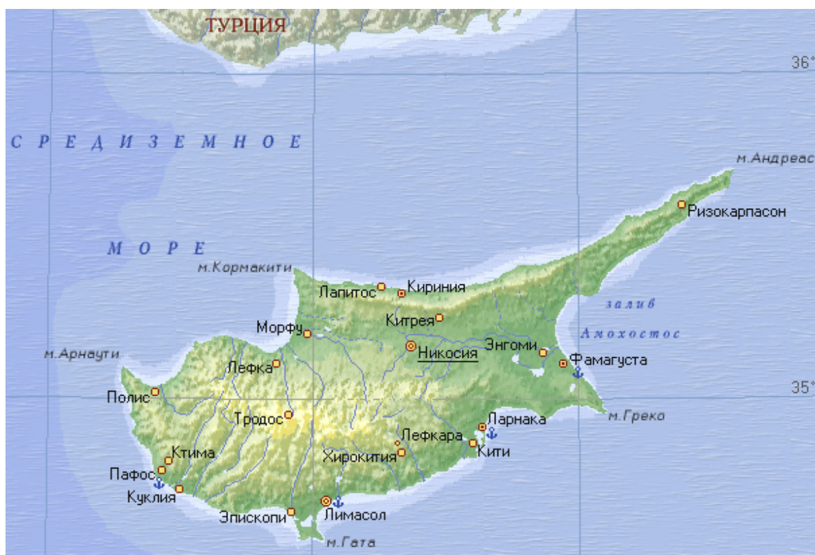
Рис. 3.15. Географическая карта Кипра

Остров Кипр – один из крупнейших в Средиземном море (рис. 3.15). В настоящий момент остров разделен на две части: южную греко-кипрскую часть – Республика Кипр, и северную турецкую часть – Турецкая республика Северный Кипр. Это произошло после высадки на остров турецкой армии в 1974 г.