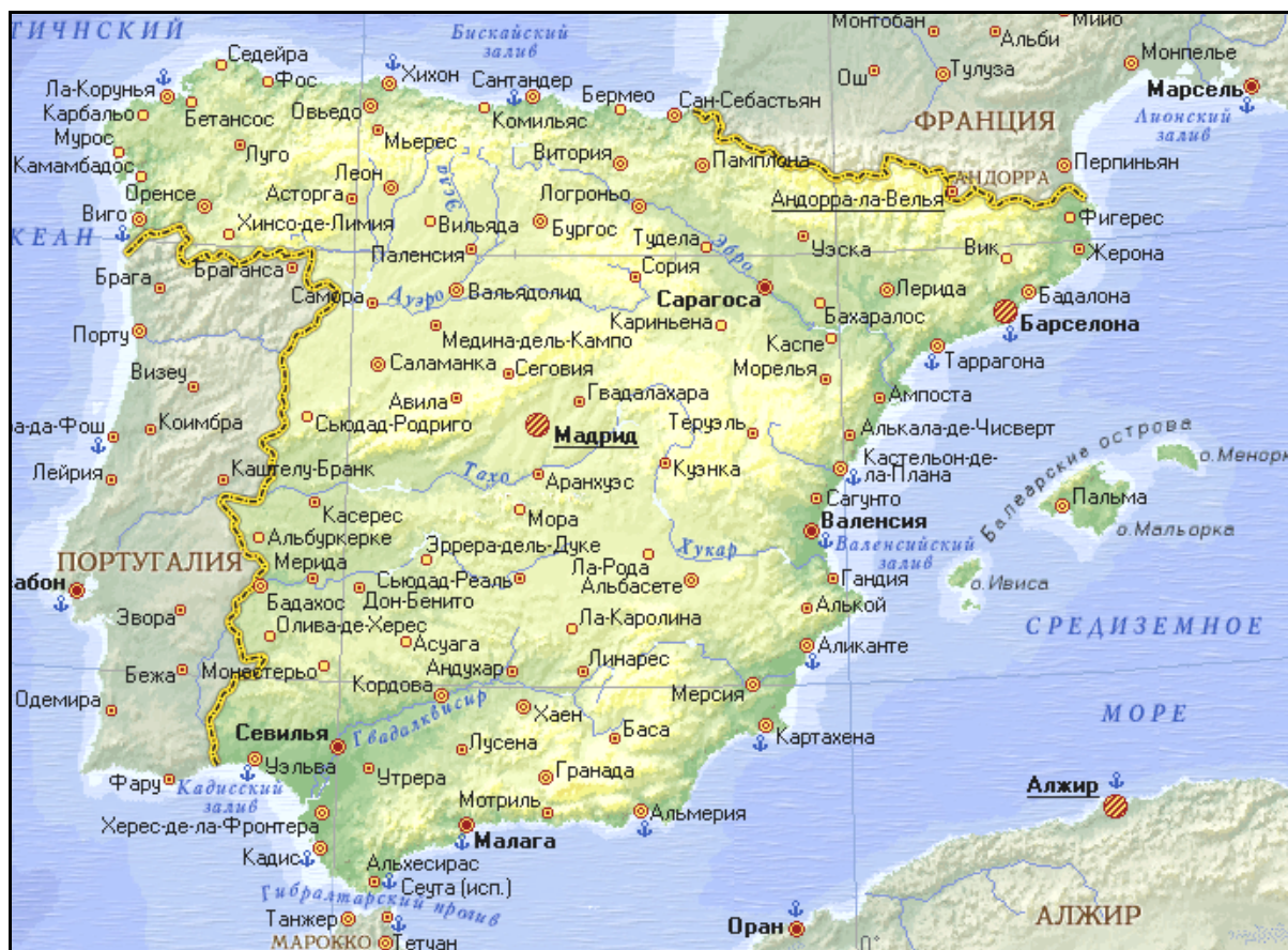
Рис. 3.7. Географическая карта Испании

обширной колониальной империи: города Мелилья и Сеута (расположены на побережье Африки), острова Велес-де-ла-Гомера, Алусемас, Чафаринас у Марокканского побережья. К территории Испании относятся также расположенные в Средиземном море Балеарские острова (Ивиса, Мальорка, Менорка) и Канарские острова (в Атлантическом океане), имеющие статус провинции и принадлежавшие Испании еще до путешествий Колумба.