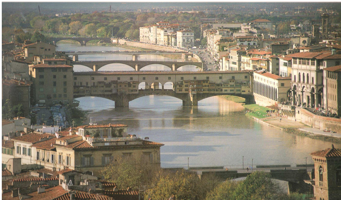
Рис. 3.9. Флоренция

Ренессанса. Рядом расположена колокольня Джотто. Одна из самых знаменитых церквей Флоренции – готическая базилика Санта-Кроче – усыпальница Микеланджело, Галилея, Макиавелли, Россини и других великих итальянцев. Флоренция славится своими музеями, самый известный из которых – знаменитая галерея Уффици.