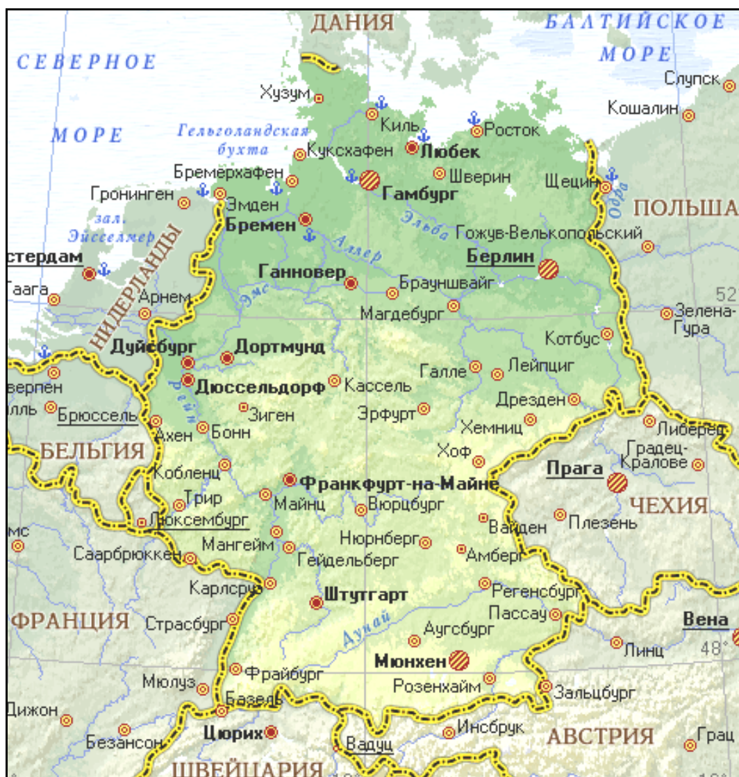
Рис. 3.3. Географическая карта Германии