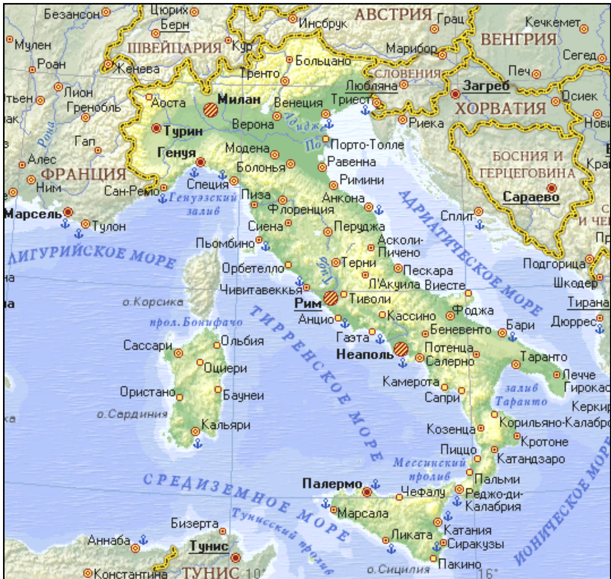
Рис. 3.8. Географическая карта Италии

Италия – государство в центральной части Южной Европы в бассейне Средиземного моря (рис. 3.8). Апеннинский полуостров, на котором расположена Италия, глубоко вдается в Средиземное море, разделяя его почти пополам. Полуостров имеет настолько специфическую форму, что его очертания знакомы каждому школьнику – это изящный сапог (ботфорт) с высоким каблуком и шпорой. По мнению футболистов «итальянский сапог» жонглирует как мячами Сицилией, Сардинией (Ит.) и Корсикой (Фр.) – крупнейшими островами Средиземноморья.