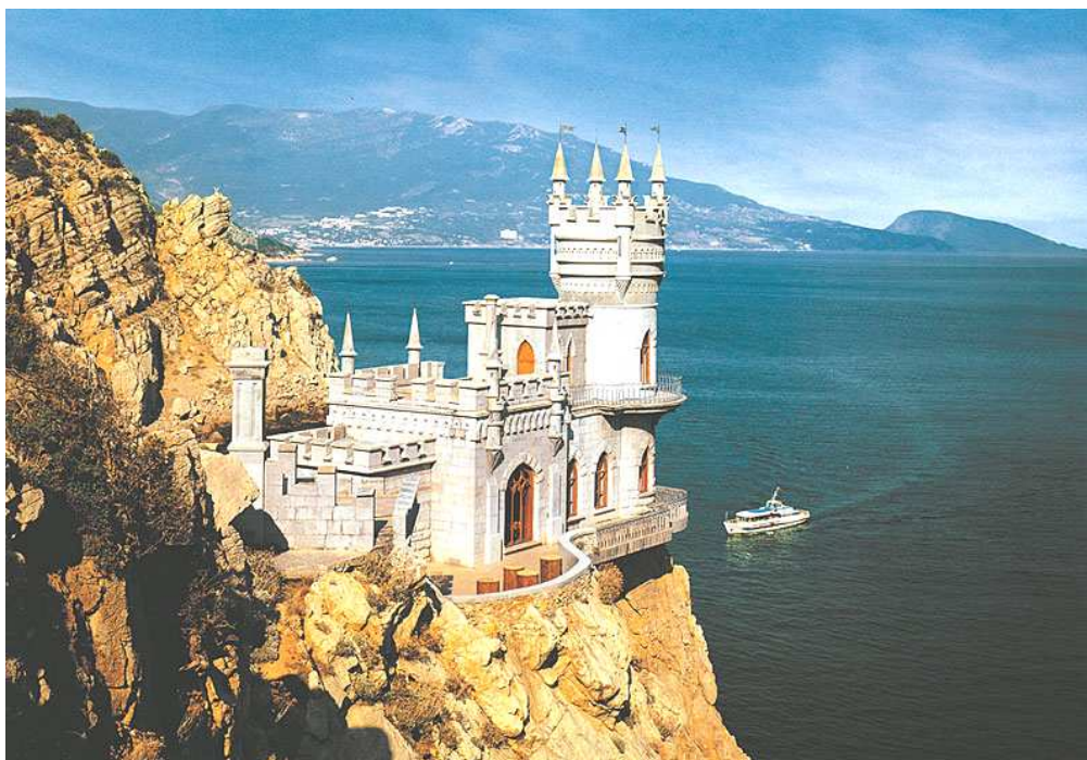
Рис. 4.2. Ласточкино гнездо

Южный берег Крыма (пышная субтропическая природа, наиболее развитая рекреационная инфраструктура, туристский центр международного значения «Большая Ялта»), юго-восточное побережье (район туризма и отдыха, основной центр – г. Феодосия), западное побережье (санаторно-курортное обслуживание, г. Евпатория – ведущий центр детского отдыха и лечения, благодаря теплomu прибрежному мелководью и песчаным пляжам), горный Крым (трассы горно-пешеходных маршрутов) и степной Крым (неразвитость туристской инфраструктуры и рекреационных функций).