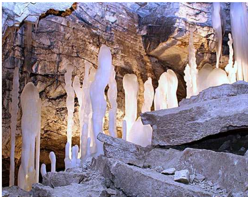
Рис. 4.6. Кунгурская ледяная пещера

Климат района континентальный. Уровень световой солнечной радиации изменяется от недостаточного на севере (1650 ч) до умеренного (1800 ч). На севере уровень ультрафиолетовой радиации зимой недостаточен, на остальной территории оптимален. Безморозный период длится от 95 до 140 дней. Лето теплое. Средняя температура июля составляет + 18°C. Купальный сезон на севере Уральского района довольно короткий – всего около одного месяца, тогда как на юге он достигает трех. Зима умеренно холодная. Средняя температура января – 15°C. На севере снежный покров держится 150 – 190 дней, а на юге – около 110 дней. Его высота достигает 40 – 60 см.