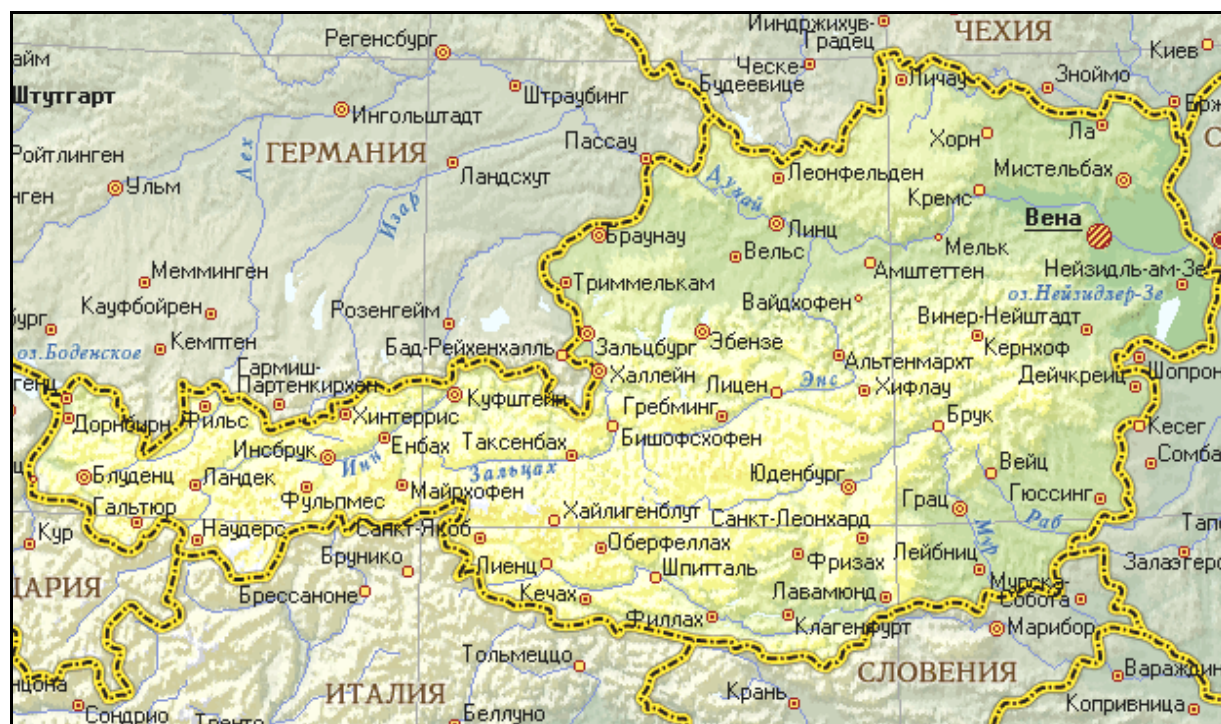
Рис. 3.2. Географическая карта Австрии

Австрия – небольшая (83,9 тыс. км 2 ) страна в Центральной Европе (рис. 3.2). Находясь в центре пересечения основных авиационных, железнодорожных и автомобильных магистралей, соединяющих Западную Европу с Восточной, Северную с Южной, она стала важным транзитным центром всего Европейского региона. Австрия не имеет выхода к морям. Она граничит с высокоразвитыми государствами, с высокими доходами населения, для которого характерна высокая туристская подвижность. Соседями Австрии являются Швейцария, Германия, Чехия, Словакия, Венгрия, Италия, Словения, Лихтенштейн.