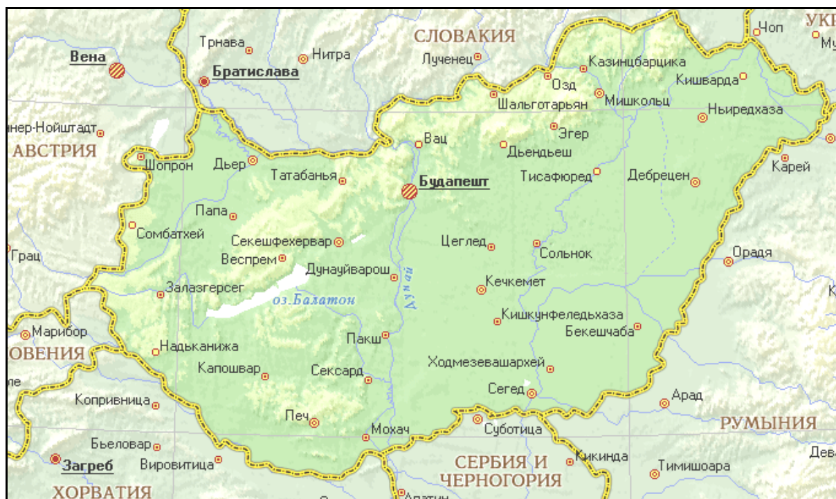
Рис. 3.11. Географическая карта Венгрии

Гористая область пересекает страну по диагонали с запада на восток. На западе от Дуная находятся Задунайские средние горы: Кестхейские горы, Баконь, Вертеш, Герече, Пилиш, Вицеградские горы. На востоке от Дуная – Северные средние горы: Бержень, Черхат, Матра, Бюкк и Земпленские горы.