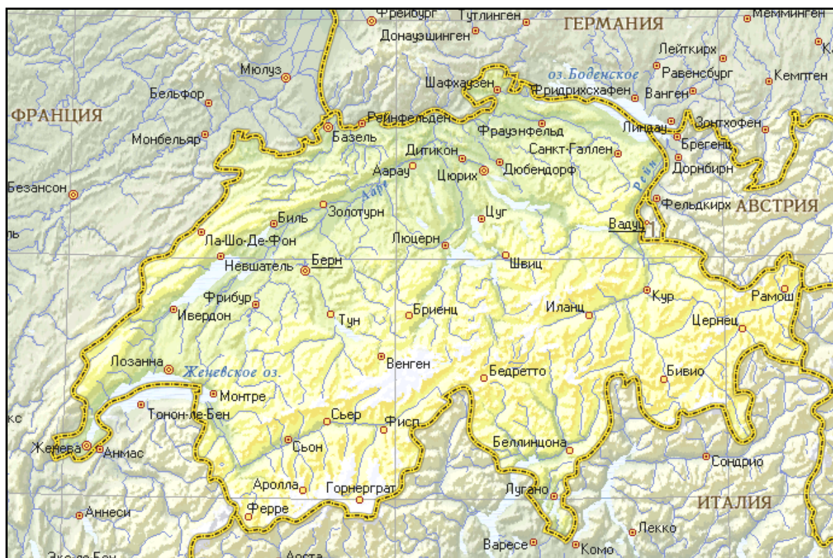
Рис. 3.4. Географическая карта Швейцарии

Швейцария расположена в Центральной Европе. Она граничит с Германией, Австрией, Лихтенштейном, Италией и Францией. Ее площадь составляет 41,29 тыс. км 2 (рис. 3.4).