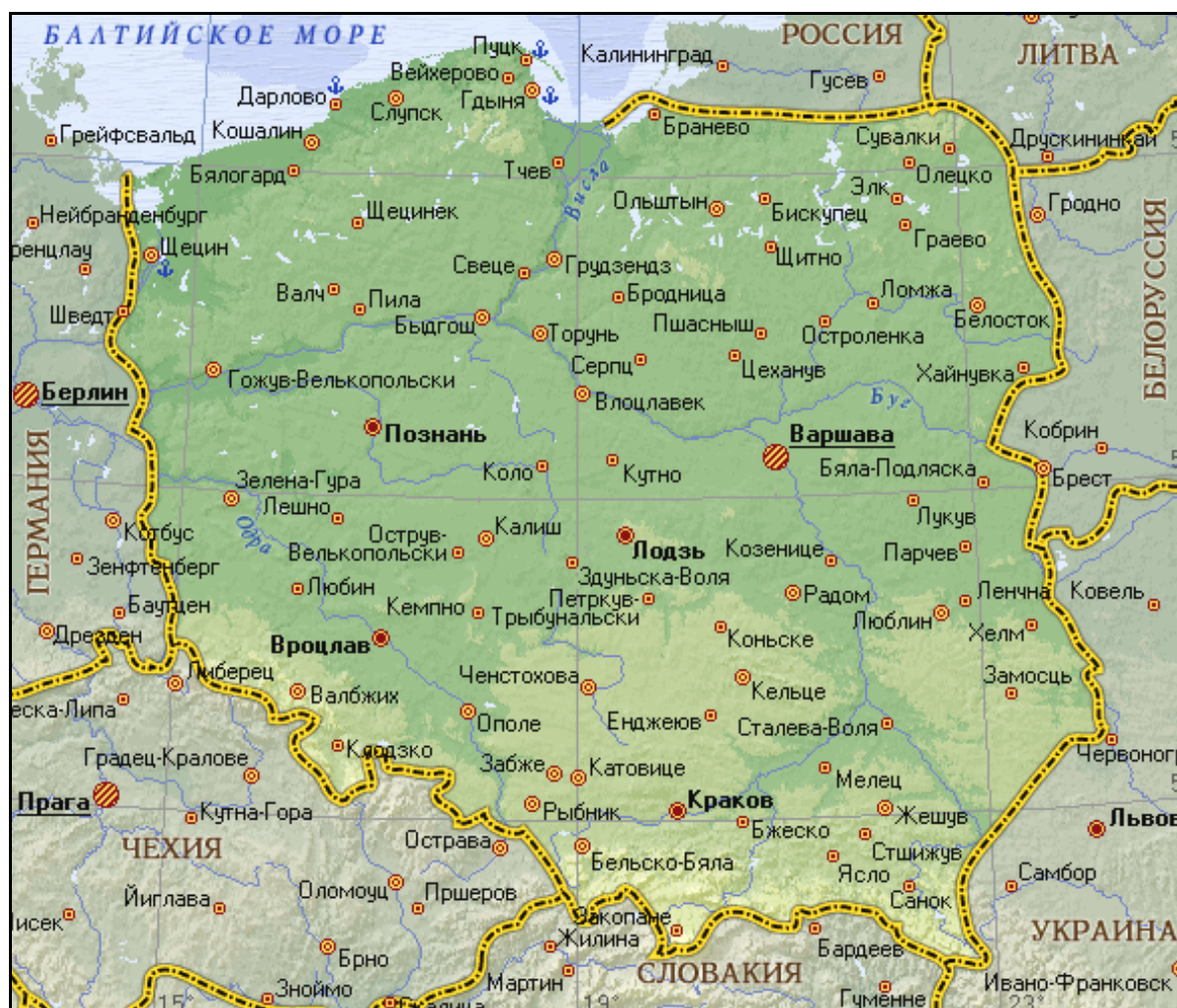
Рис. 3.12. Географическая карта Польши

Польша – государство в Центральной Европе (рис. 3.12). Граничит с Россией, Литвой, Беларусью, Украиной, Словакией, Чехией, Германией; на севере омывается Балтийским морем. Длина сухопутных границ – 3110 км, морских – 497 км. Площадь территории составляет 312 680 км 2 .