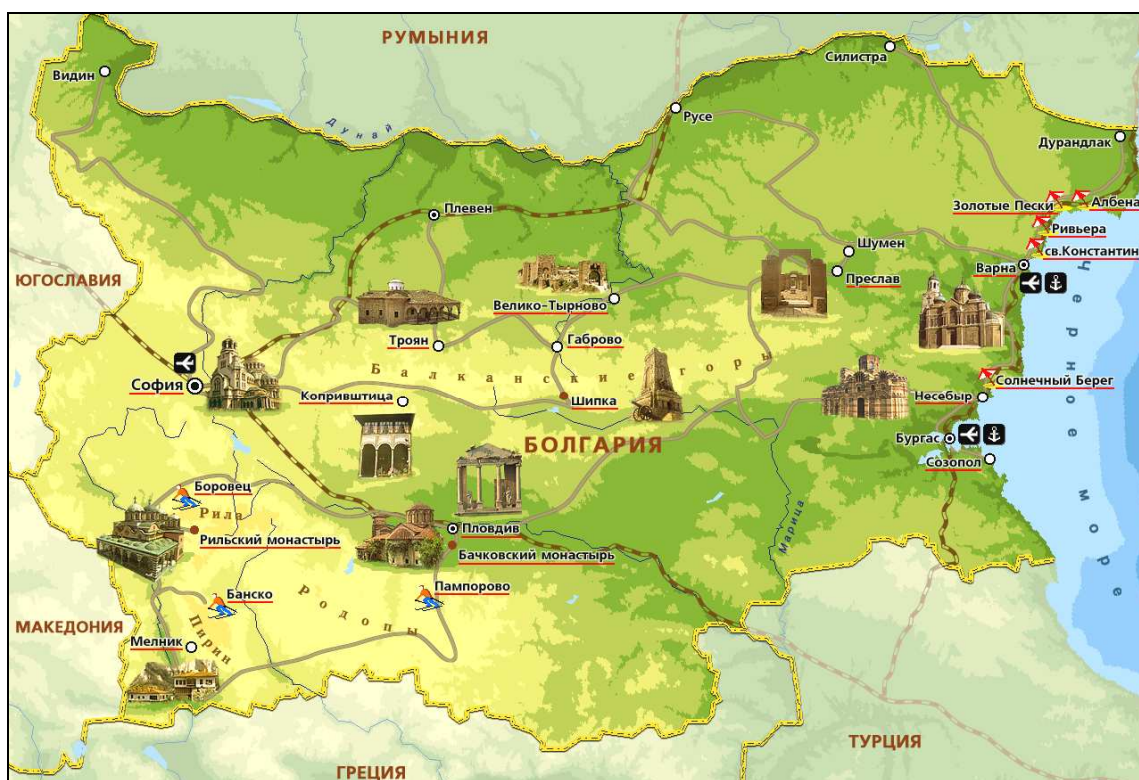
Рис. 3.10. Географическая карта Болгарии

Климат. В целом климат Болгарии умеренно континентальный. Из всех стран Западной Европы (за исключением Финляндии) в Болгарии самая большая среднегодовая амплитуда температуры (+ 25°C).