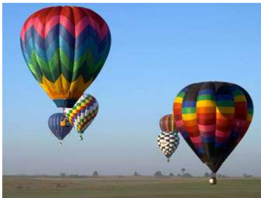
Рис. 2.1. Путешествие на воздушных шарах

Джипинг – один из популярных видов приключенческого туризма, езда по бездорожью на джипах. Джип – это условное и обобщенное название внедорожных легковых автомобилей. Известная фирма «Джип» выпускает внедорожные автомобили с одноименным названием. Это специальные автомашины с приводом на все колеса, блокировкой мостов, крепким кузовом, широкими шинами, большой мощностью двигателя. На этих машинах проводятся знаменитые международные соревнования Кэмел Трофи.