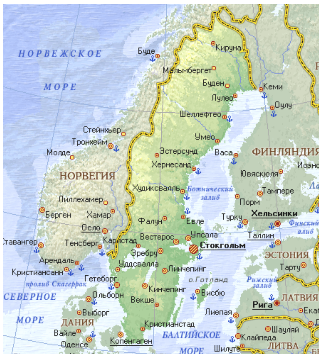
Рис. 3.6. Географическая карта Швеции

Швеция – государство на севере Европы, занимает восточную и южную части Скандинавского полуострова (рис. 3.6). На северо-западе и западе граничит с Норвегией (1657 км), на северо-востоке – с Финляндией (536 км). На востоке омывается Балтийским морем и его Ботническим заливом; на юге – проливами Эресунн, Каттегат и Скагеррак. Территория Швеции вытянута в направлении с юго-юго-запада на северо-северо-восток на 1154 км. Швеции принадлежат острова Готланд и Эланд в Балтийском море. Площадь страны составляет 449,7 тыс. км 2 .