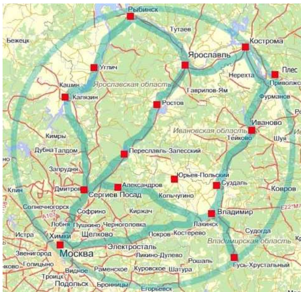
Рис. 4.5. Золотое кольцо России

да относятся 11 радиальных железнодорожных линий, 15 автомагистралей, 4 крупных аэропорта, 2 речных порта. Все города областного значения, расположенные в Центральном районе, имеют хорошую транспортную связь с Москвой. В недавнем прошлом район специализировался на познавательном туризме в масштабе СССР. Во всех областных городах имеются гостиницы и другие объекты, ориентированные на прием туристов.