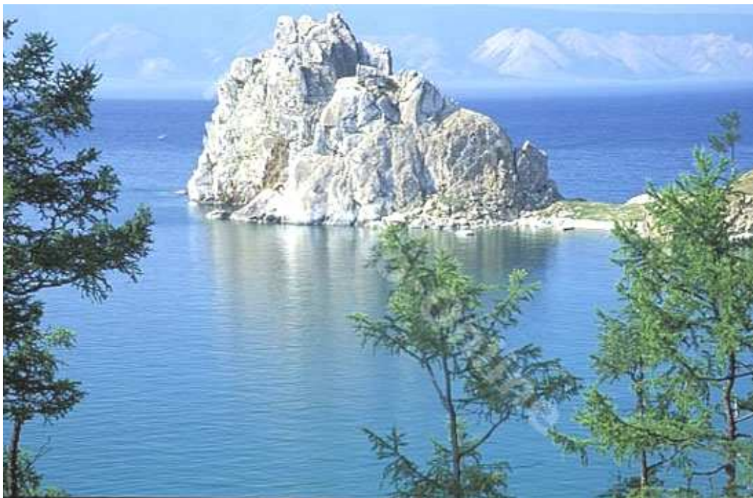
Рис. 4.7. Озеро Байкал – объект всемирного наследия ЮНЕСКО

Инфраструктура региона развита в недостаточной мере. Главной транспортной магистралью является Транссибирская железная дорога с отдельными отходящими ветками, а также отдельные участки БАМа. Имеются и автомагистрали. Практически все крупные города связаны авиалиниями. По рекам Обь, Иртыш, Енисей, Ангара, Лена, Амур проходят водные маршруты.