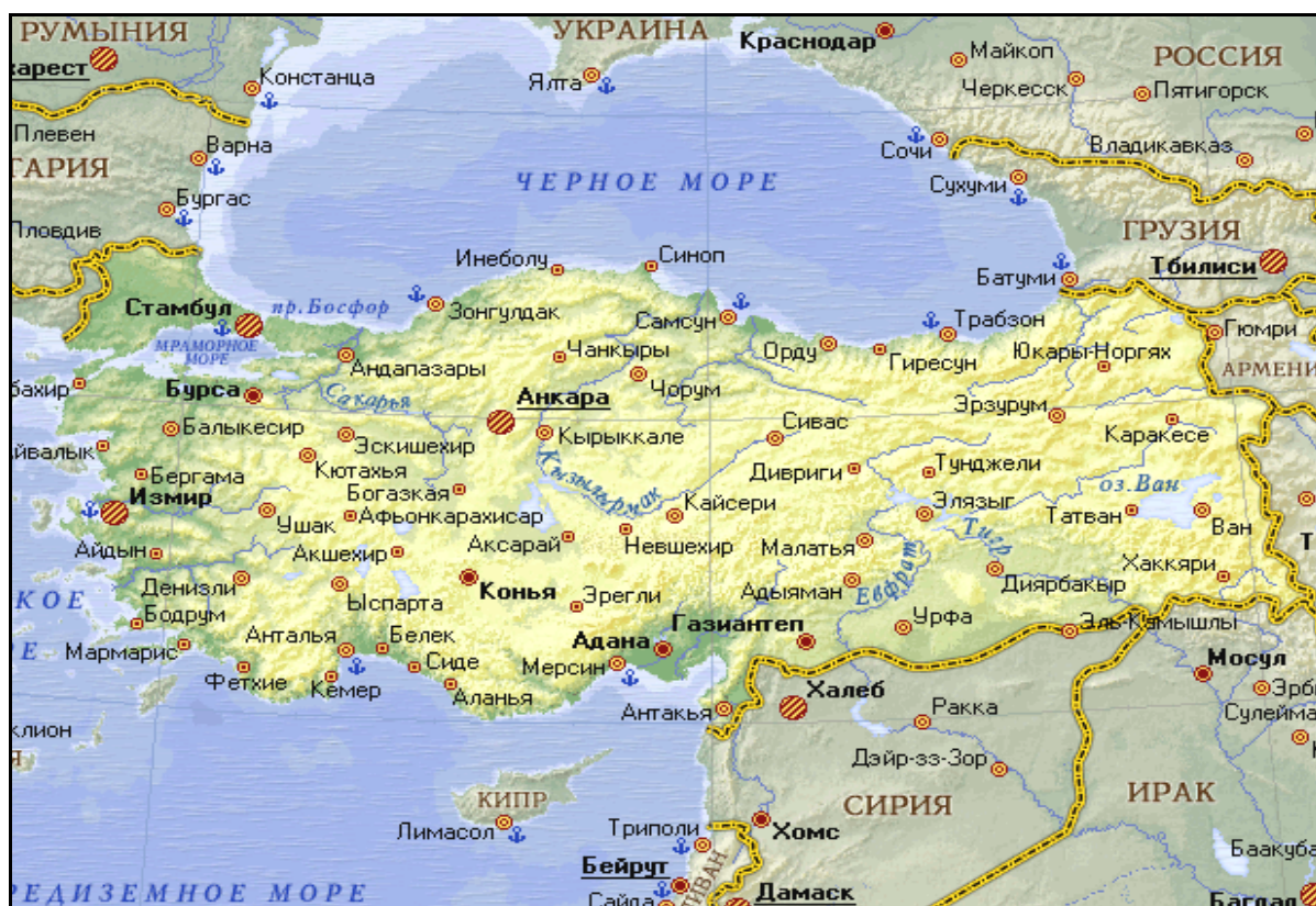
Рис. 3.13. Географическая карта Турции

Турция лежит в пределах двух обширных нагорий. Она занимает полностью Малоазиатское нагорье и большую часть Армянского нагорья. Кроме того, в Турции находятся незначительные приморские низменности (на севере и юге Малой Азии), равнины и низкие массивы (Европейская Турция) и окраина плато Джебзире (на крайнем юго-востоке). Средняя высота поверхности Турции около 1000 м.