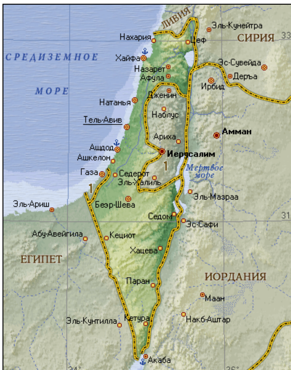
Рис. 3.14. Географическая карта Израиля

Государство Израиль располагается в Юго-Западной Азии (рис. 3.14), хотя ВТО относит его к Европейскому туристскому региону. Израиль – маленькая страна; на момент создания в 1948 г. его площадь составляла всего 14,1 тыс. км 2 , но в результате войн с окружающими арабскими государствами территория страны увеличилась почти до 21 тыс. км 2 . Тем не менее, с севера на юг страну можно пересечь за 6 – 7 ч, а с запада на восток за 1,5 – 2 ч.