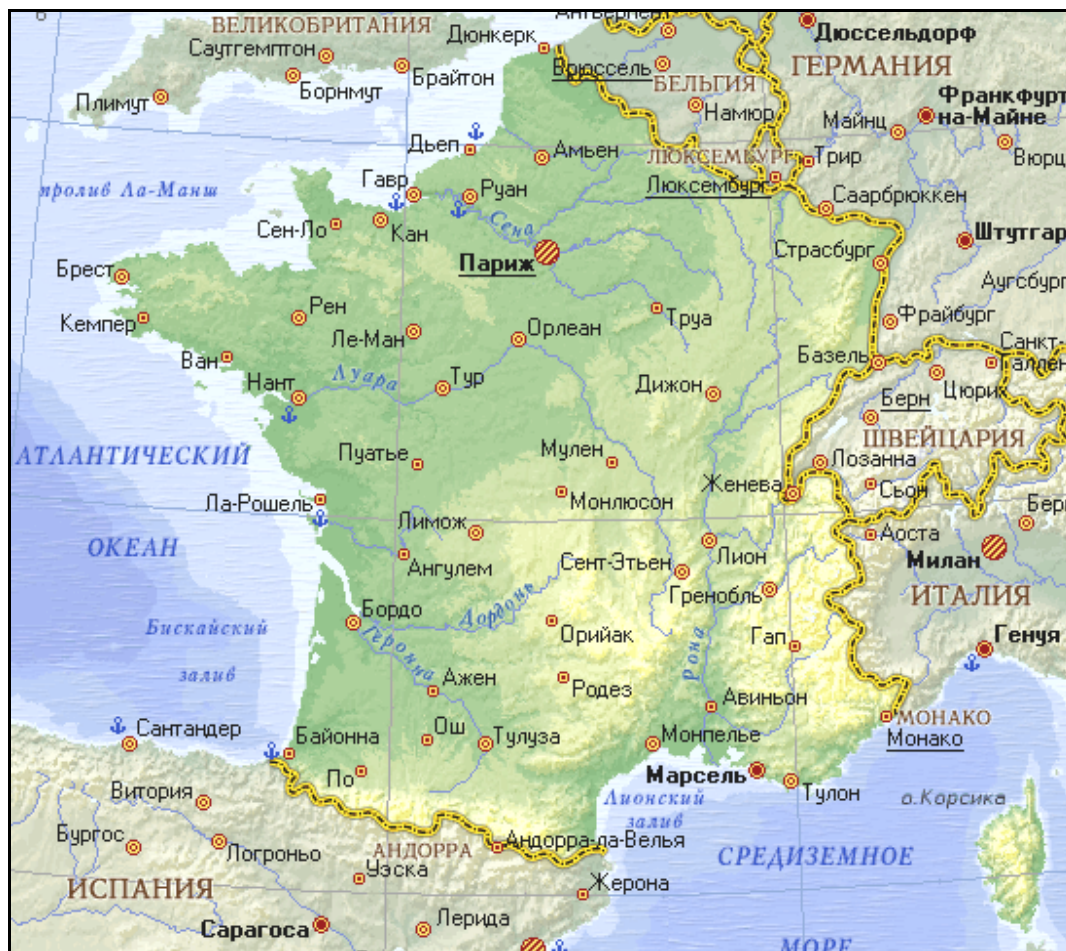
Рис. 3.1. Географическая карта Франции

Франция – государство в Западной Европе (рис. 3.1). Хорошее развитие индустрии туризма Франции связано с удобным рекреационно-географическим положением и великолепными природными и культурно-историческими рекреационными ресурсами страны.