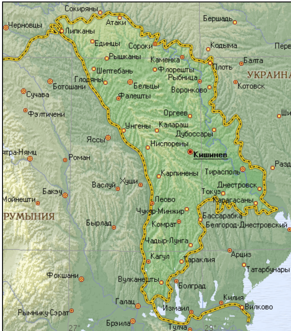
Рис. 4.3. Географическая карта Молдавии

Республика Молдова, расположенная в междуречье Прута и Днестра (историческое название – Бессарабия), по площади территории (33,76 тыс. км 2 ) уступает всем государствам СНГ, за исключением Армении, однако по живописности ландшафтов и благоприятности агроклиматических условий может соперничать с любой страной Европы (рис. 4.3).