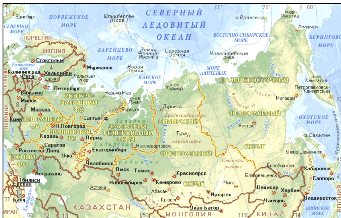
Рис. 4.4. Географическая карта России

плоскогорье с отдельными горными массивами (до 1701 м). Горные области преобладают на востоке и юге страны. В Европейской части это хребты северного склона Большого Кавказа, где расположена высшая точка России – гора Эльбрус (5642 м). Вдоль южной границы Азиатской части России протянулись горы Южной Сибири, включающие Алтай; Кузнецкий Алатау; Саяны; горы Тувы, Прибайкалья и Забайкалья; Становое нагорье.