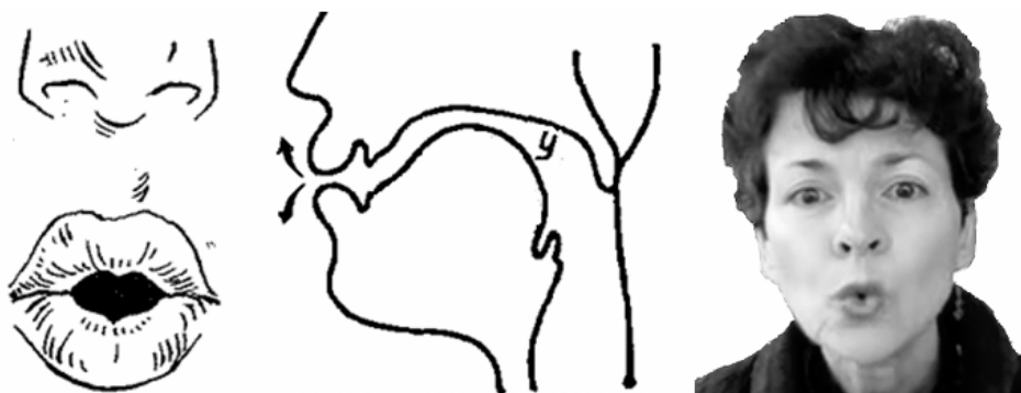
Рисунок 1 – Зрительная информация, используемая методом артикуляторной коррекции (артикуляция французского гласного [y])

бами маленькую пуговичку, а языком проверять, есть ли у нее дырочки. Таким образом от обучаемого получают достаточно сильное выдвигание губ вперед, закрытый характер гласного и непривычную для русскоговорящих продвинутость языка вперед при артикуляции огубленных гласных. Во-вторых, выполнение упражнений обязательно сопровождается установкой «слушаем и повторяем за диктором». На деле эта установка является трудновыполнимой для обучаемого, поскольку при становлении родного языка развитие перцептивной базы языка происходит быстрее, что в дальнейшем является стимулом для развития артикуляционной базы. При изучении иностранного языка перцептивная база этого языка не имеет опережающего развития, напротив, активно стимулируются виды речевой деятельности, связанные с развитием артикуляционной базы: чтение, пересказ, говорение. В результате перцептивная база иностранного языка не может оказывать стимулирующее воздействие на развитие артикуляционной, т.е. индивид не в состоянии адекватно оценить качество артикулируемого им речевого отрезка.