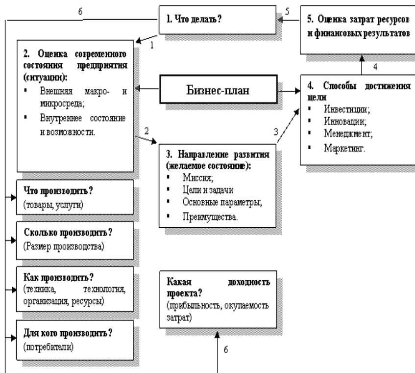
Рис. 8.1. Назначение бизнес-плана и его основные элементы

В упрощенном виде назначение бизнес-плана и его основные элементы представлены на рис. 8.1.