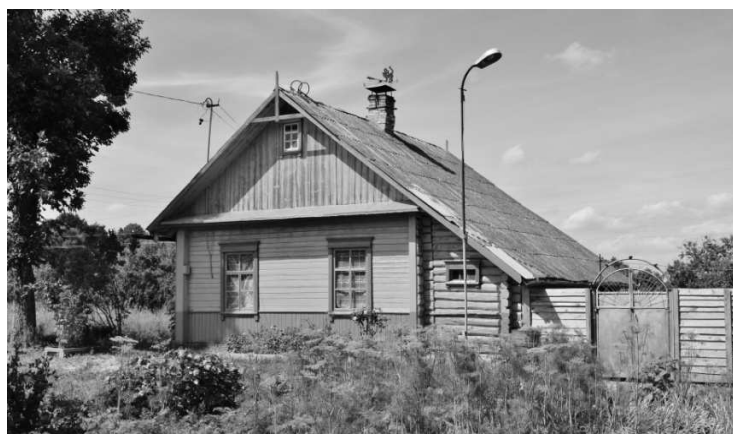
Рисунок 2 – Жилой дом в Рогатичах Полоцкого района

Стремление уберечь от хищников домашний скот, обеспечить удобную связь всех построек и максимально использовать тепло от печи привело к созданию планировочной структуры, основанной на пристройке хлевов к продольной, теплой (возле нее стояла печь) стене дома. Первоначально крыша хлева являлась продолжением крыши жилого дома, а сам хлев делали небольшим, только около сеней. Причем, вход в него был один – через сени. Впоследствии хлевы стали располагать вдоль всей продольной стены. Объемно-пространственное построение такого двора-комплекса получало асимметричное решение, органично связанное с природным окружением и дополнявшее живописную свободную застройку северобелорусской деревни. Именно в этой части Беларуси, в Поозерье, дворы-комплексы имели наибольшее распространение. Затем их начали сменять дворы веночного типа, в которых создавать непосредственную связь сеней с хлевами уже не требовалось. В 1950–70-е годы социально-экономические условия существенно повлияли на сокращение количества строений на усадьбах, уменьшение их размеров. Но сегодня, когда значительно сократились объемы хозяйственных работ на усадьбах, уменьшилось число членов семьи, наиболее удобная, проверенная временем, хотя и простая, объемно-планировочная схема – пристройка хлевов вдоль всей стены под продолжением свеса двускатной кровли (рис. 2), опять стала востребованной.