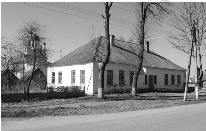
Рисунок 5 – Старинное здание, возможно ранее бывшее корчмой, в Улле Бешенковичского района

8. Местности, связанные с легендами, преданиями, известными историческими личностями, будут привлекательны даже в том случае, если там не сохранилось каких-то сооружений, связанных именно с теми событиями. Поэтому любое другое, расположенное в этой своеобразной мемориальной зоне сооружение, пусть более позднее, не имеющее статуса памятника и не обладающее какими-либо особыми архитектурно-художественными достоинствами, будет иметь особую значимость. Оно является невольным материальным подтверждением некогда происходивших здесь событий. Это сооружение может быть реконструировано и приспособлено для современных функций, связанных с туристической деятельностью, причем это возможно и без стремления к воссозданию достоверности той далекой исторической эпохи. Это может быть вполне современный объект, выполненный с учетом принадлежности к местной культуре. Желательно было бы в его архитектуре отразить специфику местных архитектурно-художественных традиций.