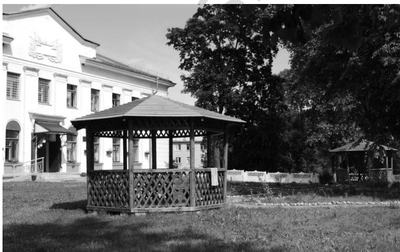
Рисунок 6 – Беседки в Ветрино Полоцкого района

По-прежнему востребованы малые архитектурные формы. Заметными акцентами среды стали места отдыха с соответствующим оборудованием – от обычных скамеек до замысловатых и в то же время простых решений с использованием естественных природных форм. Разнообразнее стали беседки, расширились их функции (рис. 6). Это теперь не только место уединения, а и место встреч отдыхающих. Для их создания, помимо традиционных приемов декорирования в виде резьбы, используются активные формы шатровых завершений, эффектность каркасных конструкций, естественность дерева.