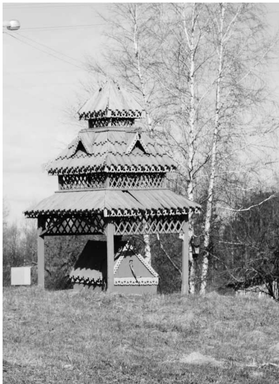
Рисунок 7 – Колодец в Сухом Бору Полоцкого района

В последнее время вдоль дорог, особенно на перекрестках и въездах в населенные пункты, появилось немало крестов, которые прежде естественно воспринимались рядом с храмами, за церковной оградой или на кладбище. То, что крест – это древнейший универсальный магический знак и именно в христианстве он получил особое предназначение, известно, пожалуй, всем. Этот с виду простой символ отражает заложенную в природе двойственность практически всех явлений, т.е. одновременное сосуществование единства и неразрывности противоположностей. Новые, воздвигнутые в наше время придорожные кресты, своей праздничностью и одновременно строгостью заметно выделяются среди малых архитектурных форм, обычных в сельских поселениях.