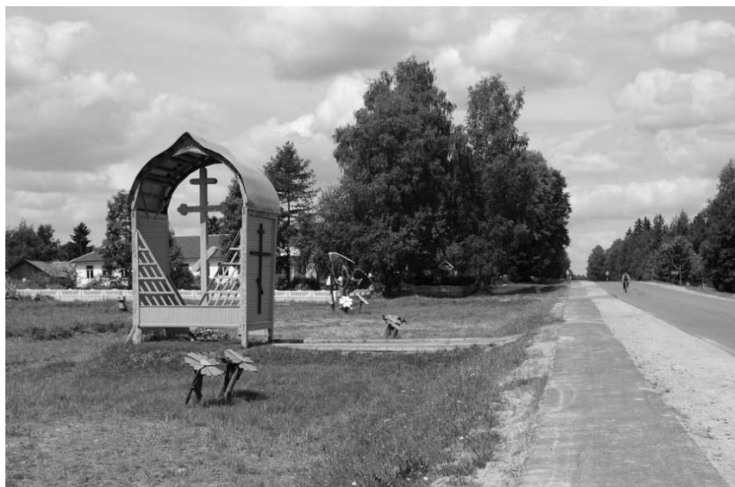
Рисунок 8 – Придорожный крест в Соколище Россонского района на месте, где ранее стояла церковь

ников архитектуры в контексте среды жизнедеятельности нашего времени, так и путем использования композиционных и архитектурно-декоративных решений, навеянных высокими эстетическими качествами достижений народных строителей.