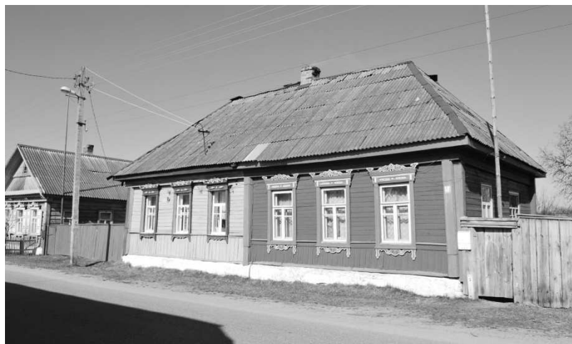
Рисунок 4 – Жилой дом в Улле Бешенковичского района. Конец XIX – начало XX вв.