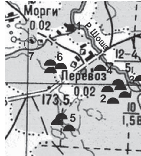
Мал. 2. Карта археалагічных помнікаў у Ваколіцах в. Перавоз:

Верагодна, што да часу існавання культуры смаленска-полацкіх доўгіх курганаў належыць гарадзішча Перавоз (Глыбоцкі раён). Яно было адкрыта Я.Н. Драздовічам у 1937 годзе [1, с. 128]. У 1989 годзе Л.У. Дучыц праводзіла археалагічныя раскопкі курганных і грунтовых могілнікаў у ваколіцах в. Перавоз. У гэты час даследчыцай было абследавана гарадзішча. Яна інтэрпрэтуе яго функцыянальнае прызначэнне як сховішча [4, с. 3]. У 2008 — 2010 гадах гарадзішча было даследавана аўтарам. Помнік размяшчаецца ў сутоках ракі Шоша і безназоўнага ручая. Культурны слой выяўлены пасля зачысткі сценак ям невядомага прызначэння. Слой нязначны, светла-шэрага колеру, перамешаны з пя-