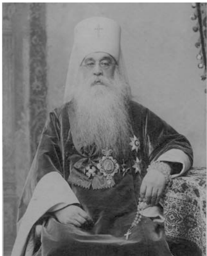
Київський митрополит Флавіан

Історію ХХ ст. перекроїла Перша світова війна, в результаті якої припинили своє існування чотири імперії: Російська, Німецька, Османська та Австро-Угорська. У Першій світовій війні брали участь 36 країн, тривала вона 4 роки і 3,5 місяці. З 70 млн. солдатів – учасників війни 10 млн. загинуло, ще 10 млн. – втрати серед цивільного населення, а 20 млн. воїнів повернулися додому інвалідами.