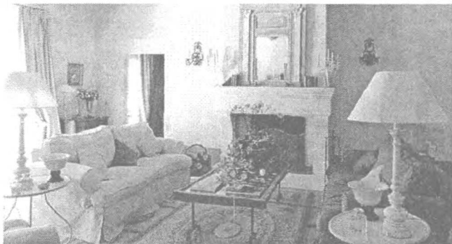
Рис. 2. Интерьер, соответствующий психотипу «меланхолик»