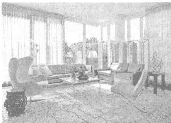
Рис. 4. Интерьер, соответствующий психотипу «сангвиник»

В результате проведенного анализа можно сделать вывод : при создании интерьера не стоит забывать, что его обитатели могут отличаться по психотипу, поэтому общие открытые пространства жилья лучше создавать в классических традициях, и уже в личных помещениях выполнять особые рекомендации для каждого типа темперамента.