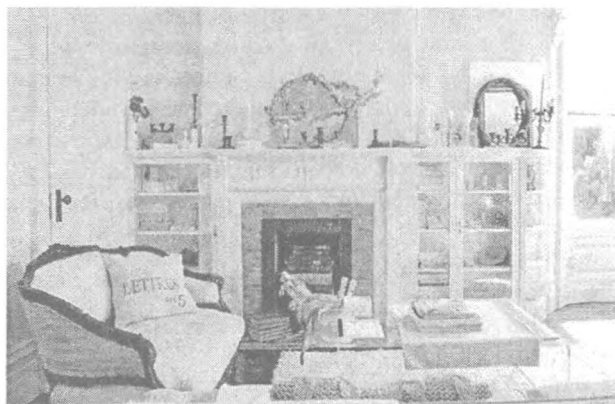
Рис. 3. Интерьер, соответствующий психотипу «флегматик»

Люди с темпераментом флегматика будут чувствовать себя комфортно в интерьерах классического, античного стиля (рис. 3).