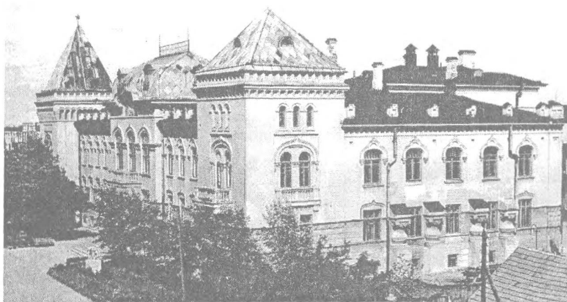
Рис. 4. Здание поземельно-крестьянского банка (фото 1957 года)

Строительство поземельно-крестьянского банка было начато в 1913 году по проекту архитектора К.К. Тарасова. Руководил строительством губернский инженер архитектор В.Ф. Коршиков. Из-за перерывов в строительстве возведение банка было окончено только в 1917 году.