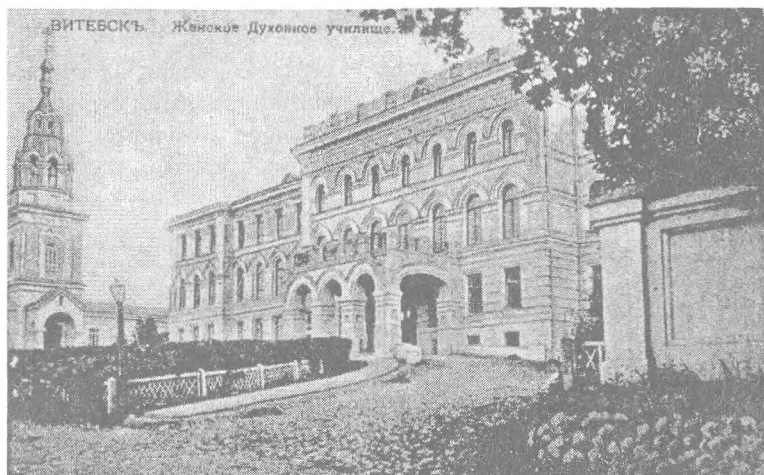
Рис. 2. Здание Полоцкого женского духовного училища (конец XX века)

Особый интерес представляет здание Полоцкого женского духовного училища (рис. 2), в котором сейчас располагается здание Витебского облисполкома. Названо училище Полоцким, так как являлось основным духовным учебным заведением для девушек в Полоцкой (Полоцко-Витебской) епархии.