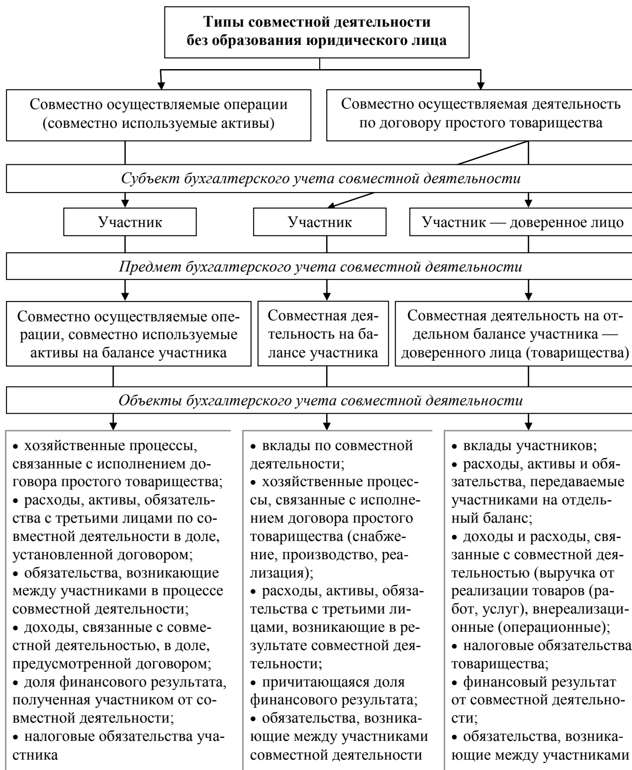
Рисунок 1 — Учетные характеристики системы бухгалтерского учета совместной деятельности без образования юридического лица

движения вкладов», который в наглядном виде отображает изменения размера, состава и структуры вкладочного капитала товарищей. Его использование позволит учесть такие неидентифицируемые с точки зрения бухгалтерского учета объекты, как деловая репутация, профессиональные знания, навыки, деловые связи.