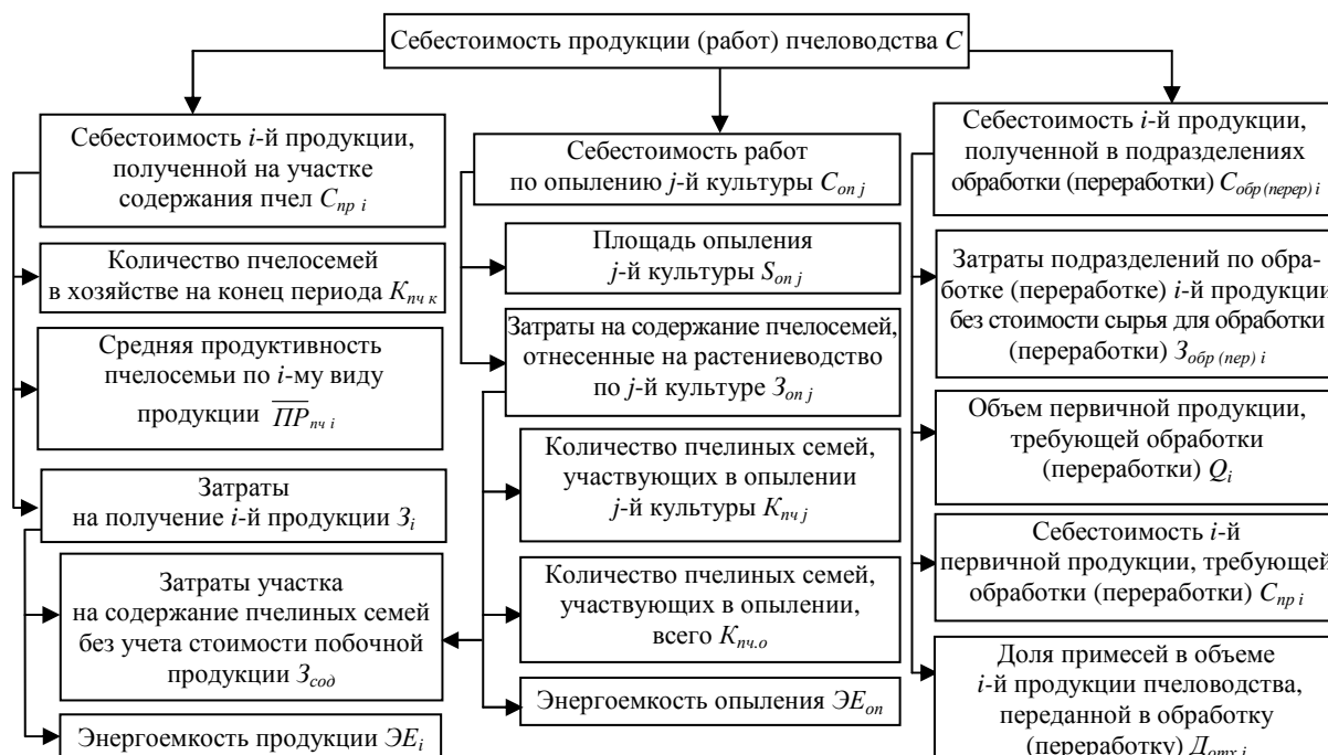
Рисунок 3 – Структурно-логическая схема факторного анализа себестоимости первичной и вторичной продукции пчеловодства

Структурно-логическая схема проведения факторного анализа себестоимости продукции пчеловодства с учетом специфики производства представлена на рисунке 3.