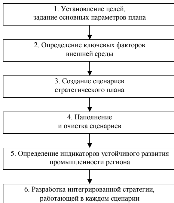
Рис. 2. Этапы формирования стратегического плана развития промышленности страны и региона

При формировании стратегического плана развития промышленности с учетом положений сценарного подхода в соответствии с [1 – 3; 7; 24 – 27] целесообразно выделять от 6 до 12 фаз в зависимости от целей и масштаба хозяйствующего субъекта. Для уровня страны и региона, по нашему мнению, их последовательность может иметь вид, представленный на рисунке 2.