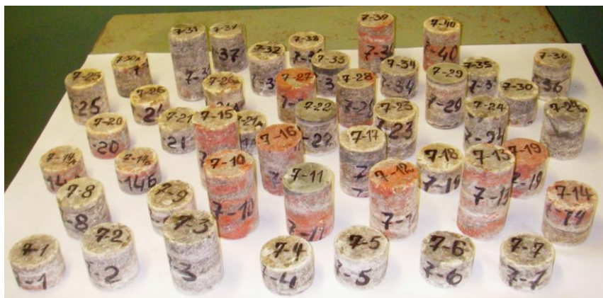
Рис. 4. Подготовленный к испытаниям керн горной породы, выбуренный коронкой производства ЗАО «СИПР с ОП»

Предварительными испытаниями были уточнены передние и задние углы резания победитовых резцов, внесены необходимые изменения в конструкторскую документацию. После доводки коронок испытания были продолжены, в частности, при бурении скважин эксплуатационной разведки в главных выработках западного «Б» направления Березовского участка шахтного поля 4 РУ. На этом участке было пробурено три скважины общей длиной 77 м. Выход товарного керна при этом составил 80...90 % (рис. 4), тогда как ранее при использовании имеющихся на руднике коронок выход товарного керна не превышал 30...35 %.