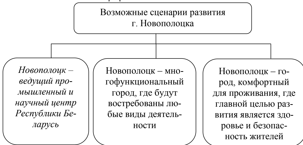
Рис. 2. Возможные сценарии развития г. Новополоцка