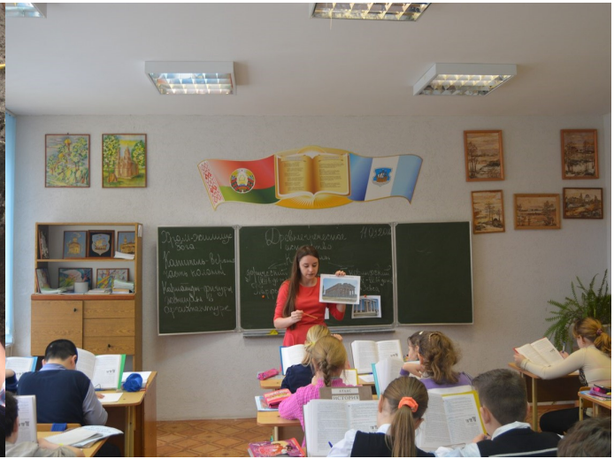
Педагагічная практыка ў групы 12-ГІС. Люты 2016 г.