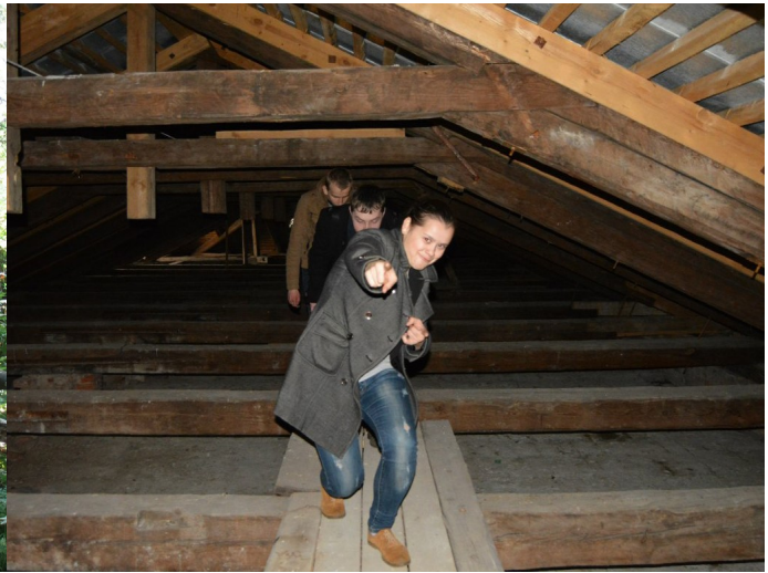
Вучэбная экскурсія на паддашша вучэбнага корпуса — будынка езуіцкага калегіума, помніка гісторыі міжнароднага значэння. Май 2016 г.