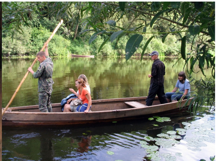
Пераправа праз р. Дзісна ў этнаграфічнай экспедыцыі. Ліпень 2008 г.