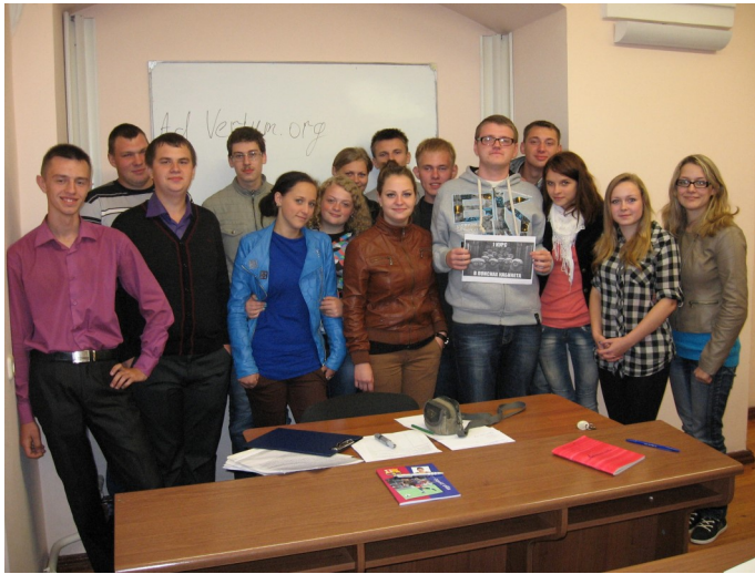
Студэнты групы 13-ГІС у першы дзень вучобы. Верасень 2013 г.