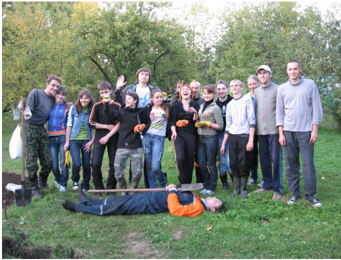
Студэнты групы 12-ГІС на першых раскопках. Верасень 2012 г.