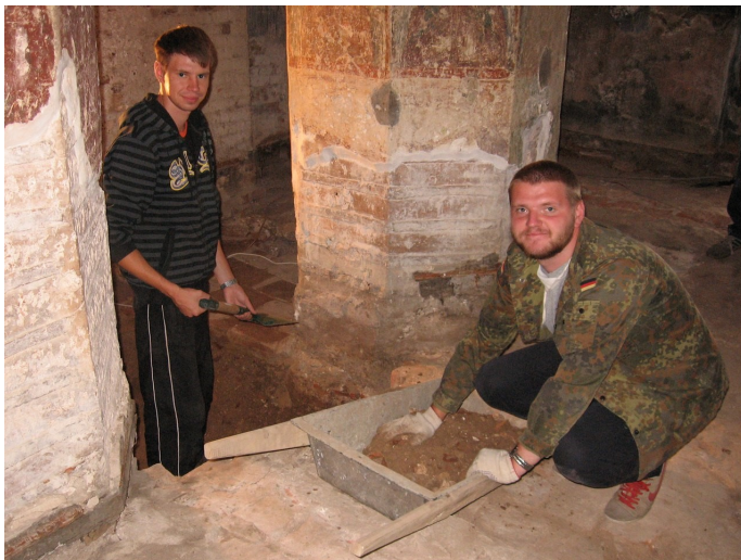
Раскопкі ў Спаса-Праабражэнскай царкве Спаса-Еўфрасіннеўскага манастыра, помніку XII ст. Ліпень 2015 г.