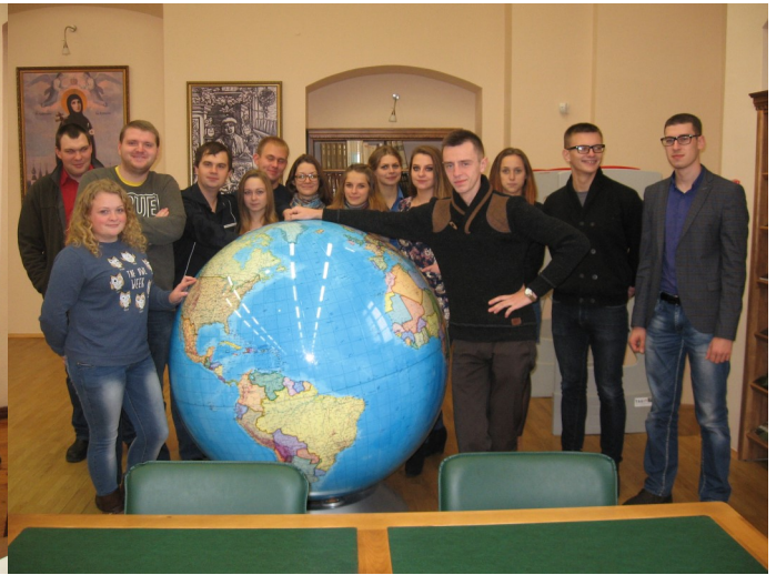
Студэнты групы 13-ГІС на чацвёртым курсе. Лістапад 2016 г.