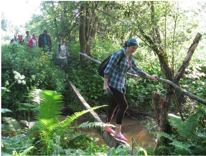
Дарога да раскопа. Археалагічныя раскопкі. Ліпень 2016 г.