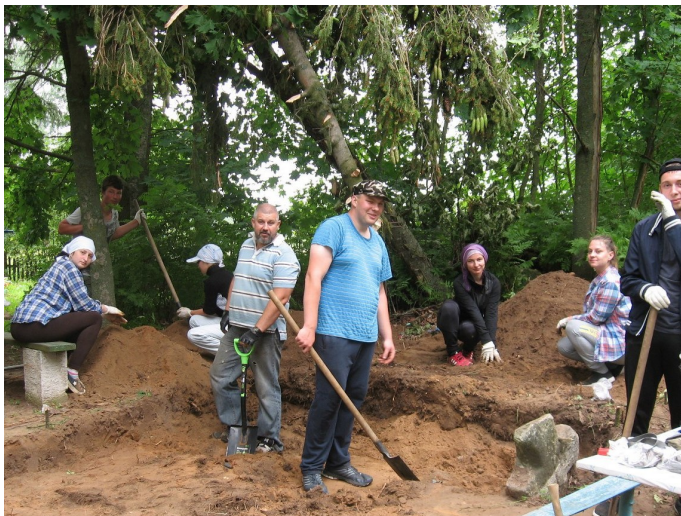
На археалагічных раскопках у Лёзненскім раёне. Ліпень 2016 г.