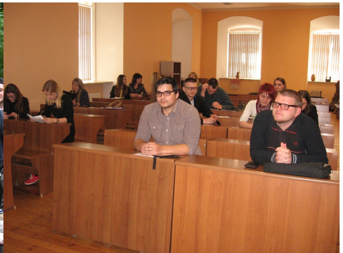
На штогадовай студэнцкай навуковай канферэнцыі. Май 2016 г.