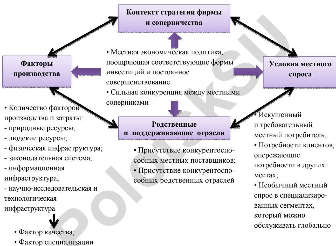
Рис. 1. Источники локальных конкурентных преимуществ

Как следует из рисунка 1, кластеры представляют одну из граней ромба (родственные и поддерживающие отрасли), но лучше всего рассматривать их как проявление взаимодействия всех четырех граней [2, с. 274]. Кластеры влияют на конкурентную борьбу тремя способами [2, с. 275]: