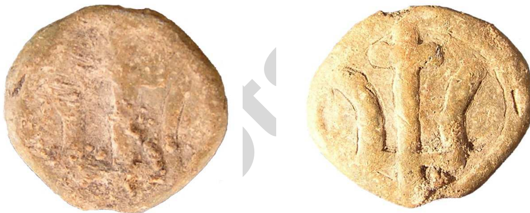
Мал. 2. Княжацкая пячатка з выявай трызубца знойдзеная ў Полацку.

Па меркаваннях Д.У. Дука, візуальнае супастаўленне дзвюх падвесак дае падставы сцвярджаць, што гэтыя дзве знаходкі маглі быць адліты ў адной ліцейнай форме і, магчыма, зроблены адным майстрам [17, с. 86]. Аналізуючы падобныя падвескі з другіх рэгіёнаў Русі, С.В. Бялецкі прыйшоў да высновы, што іх магчымая датыроўка адносіцца да 988 – 1015 г., г.зн. перыяду кіеўскага княжэння Уладзіміра Святаславіча [18, с. 261 – 262]. Выявы трызубца з яркава вылучанымі радавымі рысамі Рурыкавічаў адпавядаюць парадным знакам (тамгам) Уладзіміра Святаславіча. Гэты “знак Уладзіміра”, змешчаны таксама на златніках і сярэбраніках кіеўскага князя, з’яўляецца адметным аtryбутам улады Уладзіміра Святаславіча і яго сына, кіеўскага князя Яраслава Мудрага [19, с. 436 – 447].