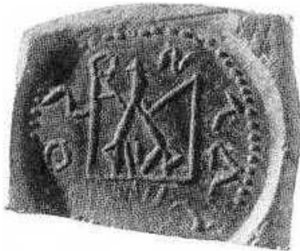
Мал. 3. Пячатка з надпісам ІЗОС(Л)АВ(О)С і выявай трызубца знойдзена ў Ноўгарадзе

дружынна-адміністрацыйнага соцыуму [22, с. 95]. Паказальна, што на выявах трызубцаў адсутнічаюць індывідуальныя асабіста-родавыя прыкметы, якія выразна прысутнічаюць на “полацкай падвеске” і пячатке Ізяслава з Ноўгарада канца X – пачатку XI стст. Паводле меркавання Е.А. Мельнікавай, адсутнасць індывідуальных прыкмет на выявах трызубцаў сведчыць пра выкарыстанне прымітыўнай яго формы, як абагульненага сімвала княжацкай улады (вылучана мной – Ю.К.) [23, с. 232]. Такім чынам прымітыўная форма трызубца з адсутнасцю радавых прыкмет, сведчыць пра агульны сімвал княжацкай улады, тады як княжацкія знакі канца X – пачатку XI стст. з Полацка і Ноўгарада сведчаць пра ўладу Ізяслава ў Полацку, як намесніка Уладзіміра.