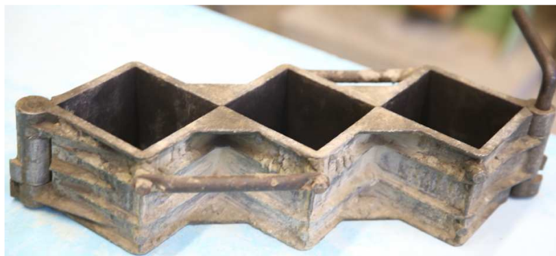
Рисунок 1. – Стальная форма для изготовления бетонных образцов