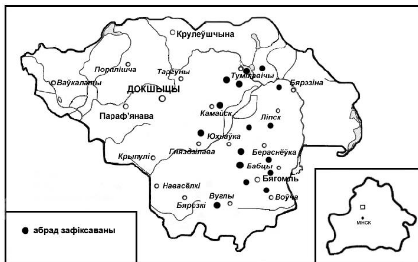
Мал. 3. Арэал абраду Вербная Дзяды на тэрыторыі Докшыцкага раёна Віцебскай вобласці

Такім чынам, на аснове аналізу этнаграфічных крыніц XIX – пачатку XXI ст. можна зрабіць наступныя высновы: 1) у комплекс веснавой памінальнай абраднасці беларусаў Падзвіння ўваходзяць Масленічныя Дзяды і традыцыі ўшанавання продкаў, прымеркаваныя да Вербніцы; 2) Масленічныя (Масляныя, Мясaedныя, Буркаўскія) Дзяды распаўсюджаны ва ўсходняй і цэнтральнай частках рэгіёна, а таксама на Докшыччыне; іх спецыфічнай рысай, у параўнанне з іншымі Дзядамі, з’яўляецца асартымент памінальных страў (бліны, «масленыя» стравы, вараныя свіныя ногі і інш.); 3) на Падзвінні спарадычна фіксуецца традыцыя наведваць могількі на Вербніцу, а на тэрыторыі Докшыцкага раёна існуюць Вербныя Дзяды, адметнасцю якіх быў посны памінальны стол; 4) для сучаснай абраднасці беларусаў Падзвіння характэрна захаванне памінальных рытуалаў на Масленіцу і Вербніцу, але ў значна спрашчаным і рэдукаваным выглядзе.