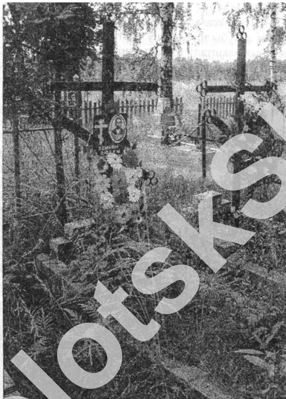
Мал. 7. Абрubby магіл з пэгля, 2006 г., в. Абраімаўка Дрыбінскага раёна Магілёўскай вобл.

домікі і абрубкі існавалі ў пахавальна-памінальнай звычайнасці разам ужо ў старажытнасці і з'яўляліся сведчаннем сацыяльнага размежавання грамадства. Занядбанне звычай будаваць на магіле зрубны дом прыпадае на 1920 – 1930-я гады, што было выклікана сацыяльна-культурнымі пераменамі ў беларускай вёсцы ў савецкі час. Разбурэнне міфалагічнай свядомасці, міжпакаленных сувязяў у вясковай грамадзе парушыла цэласнасць уяўленняў, звязаных з культуам продкаў, што прывяло да адказу ад традыцыйных пахавальна-памінальных звычайяў і традыцыйных форм надмагільных пабудоў. Разам з тым у арэале Віцебска-Магілёўскага Падняпроўя назіраецца захаванне аднаго з архаічных элементаў культу продкаў, які непасрэдна звязаны з формай надмагільнай пабудовы – сямейнай трапезы з ужываннем ежы непасрэдна на магіле продка.