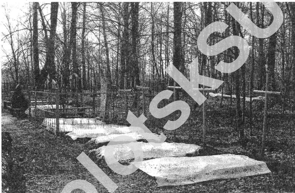
Мал. 9. Магілы, засціланыя абрусамі на Радаўніцу, 2006 г., в. Студзянец Касцюковіцкага раёна Магілёўскай вобл.

У 2006 годзе на Радаўніцу разам с сябрамі таварыства «Явар» мы праехалі па шэрагу раёнаў Магілёўскага Падняпроўя і на ўласныя вочы пабычылі і зафіксавалі сучасны стан абраду засцілання абрусамі могілак (мал. 9), іх асвяшчэння святаром і сямейных трапез. Памінальны стол накрываецца непасрэдна на магіле. Невыпадкова плоская форма магілы, яе афармленне са ўсіх бакоў абрубам, нагадвае стол. Магіла – стол звязаны з традыцыяй культавых калектыўных памінанняў продкаў. Цэнтральным месцам рытуалу служыць само месца пахавання – магіла, форма якой семантычна звязаная з язычніцкімі ахвярнікамі і алтарамі. Не выпадкова для надмагільных пабудоў на Палессі існуе назва «стіл» [22].