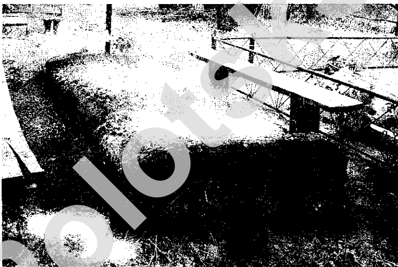
Мал. 6. Магіла з драўляным абрубам на магілках в. Грышына Клімавіцкага раёна Магілёўскай вобл. (2006 г.)

Драўляныя абрубны, якія мы зафіксавалі, зроблены або з бярэвянаў ці, часцей, з тоўстых шалёваных брусоў (мал. 6). Найбольш даўнія абрубны зрублены ў чысты вугал. У некаторых з іх тарцовыя сценкі, вышэйшыя за падоўжныя і зацэсаныя нахшталь трапецый, ці закругленыя, дзякуючы чаму яны нагадваюць надмагільныя домікі без дахаў. Гэта дазваляе нам меркаваць, што надмагіллі такога кшталту з'яўляюцца рэдуцыраванай формай зрубнага надмагілля ў выглядзе доміка. Зрубны ўспрымаюцца як знак, сімвал ідэі пасмяротнага жыцця для продкаў, якая ў сваёй паўнаце ўвасоблена ў надмагільных доміках. Яны сведчаць пра тое, што гэтая краевугольная ідэя культуры продкаў са стратай архаічнага звычая пабудовы на магіле драўлянага доміка, працягвае функцыянаваць на ўзроўні знака. Зрубны вянец – аснова дома – сімвалізуе дом, жыллё для памерлага, з'яўляецца яго знакам, нясе ў сябе сімвалічную інфармацыю. У гэтым сэнсе сімвалічным з'яўляецца і тое, што на могілках гэтага рэгіёну можна бачыць сямейныя пахаванні, калі некалькі магіл заключаны ў адзін вялікі абруб і маюць столькі крыжоў, колькі тут маецца пахаванняў. Такія пахаванні ўвасабляюць ідэю радавой еднасці ў адным агульным для ўсіх доме і ў пасмяротным жыцці.