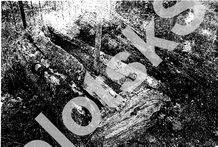
Мал. 1. Драўляныя надмагілля – «церамкі» на могілках в. Гацькаўшчына Аршанскага раёна Віцебскай вобл. (2007 г.)

Унікальныя па захаванні зрубныя надмагілля ў выглядзе домікаў выяўлены ў 2007 годзе на могілках в. Гацькаўшчына Аршанскага раёна Віцебскай вобласці (мал. 1, 2).