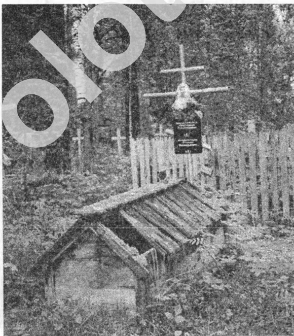
Мал. 4. Надмагільны домік беларусаў-перасяленцаў у в. Ацірка Тарскага раёна Омскай вобл. 1995 г.

Драўляныя зрубныя надмагіллі, як і «прыклады» на магілах, у выглядзе гарызантальна пакладзенага на невысокі земляны насып бярвяна даследчыкі адносяць да этнавізначальных прызнакаў культуры беларусаў [4, с. 260]. Напрыклад, звычай ставіць драўляныя «шрубцы», гэта значыць зрубны (скрыні), замест насыпу магільных халмоў на магілах, яднаў «літвінаў» паўночных раёнаў Чарнігаўскай губерні з беларускім этнасам і падкрэсліваў іх роднаскасць [14, с. 35]. Беларусы-перасяленцы канца XIX – пачатку XX стагоддзя захавалі гэты старадаўні звычай у Сібіры. У Омскай вобласці этнографам М. Беражновай і А. Мініным у 2005 годзе былі выяўлены зрубныя надмагіллі ў выглядзе хатак – «домікі» на могілках в. Ацірка Тарскага раёна (мал. 4), дзе калісі спыніліся перасяленцы з Віцебскай і Магілёўскай губерняў [15, с. 195 – 198; 16].