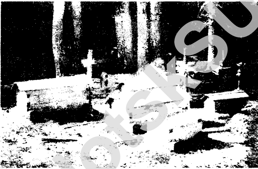
Мал. 3. Могілкі ў Аршанскім павеце Магілёўскай губ. 1895 г.

Фотаархіўныя матэрыялы сведчаць, што ў канцы XIX – пачатку XX стагоддзя на ўсходзе Беларусі вясковыя могілкі з драўлянымі надмагіллямі ў выглядзе домікаў выглядалі як сапраўдныя вясковыя паселішчы ў мініяцюры. У Музеі антрапалогіі і этнаграфіі ў Санкт-Пецярбургу захоўваецца фотаздымак 1895 года могілак у Аршанскім павеце Магілёўскай губ. 4 , на якім добра бачны драўляныя хаткі, а агульны выгляд могілак нагадвае вёску з драўлянай забудовай (мал. 3).