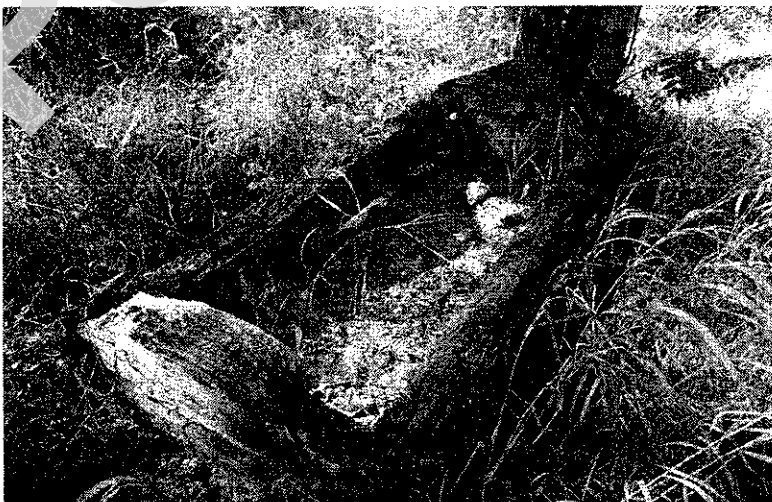
Мал. 2. Рэшты надмагільнага «церамка» на могілках в. Гацькаўшчына Аршанскага раёна Віцебскай вобл. (2007 г.)