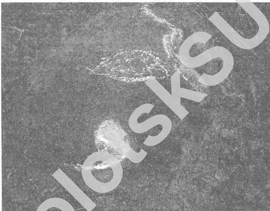
Мал. 3. Яноўскі комплекс. Камень з заморфнымі і крыжападобнымі выявамі

З паўночнага боку ад «вока» камяня № 2 знаходзіцца аб'ёмны звлікі выступ пароды, які нагадвае паўзучага гада. Каменны «гад» расцягнуўся за «вокам» па ўсёй верхняй роўніцы камяня з поўночнага захаду на паўднёвы ўсход. Выява гэтага «гада» ўзвышаецца над роўніцай камяня на 1,5 см, даўжыня яго – 40 см, шырыня вагаецца ад 3 да 4 см.