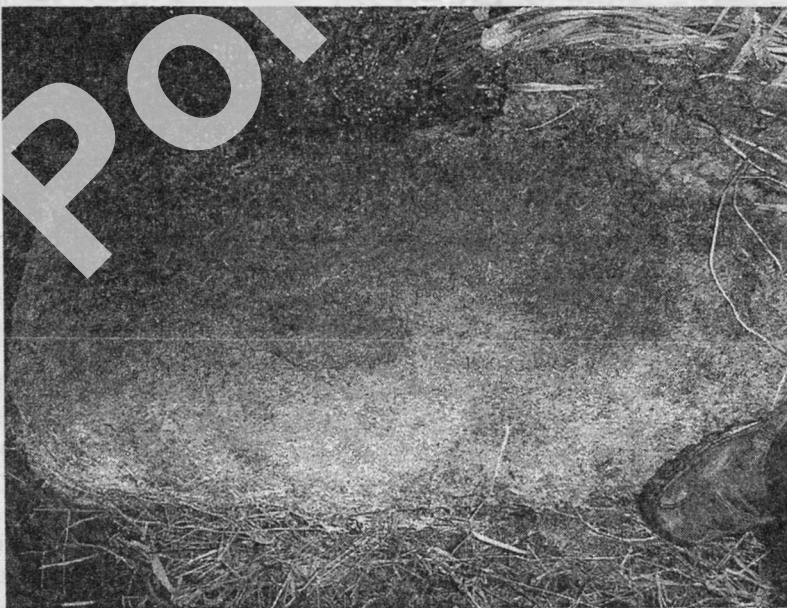
Мал. 2. Яноўскі комплекс. Камень з выявай вока (?)

Камень № 1. Знаходзіцца ў вадзе р. Лынтупкі ля старога брода дарогі, якая злучала шашу Свір – Лынтупы з былой в. Янова (мал. 2). Камень блёкла-цаглянага колеру, па сваёй форме нагадвае страху вясковай хаты. Доўгая вось каменя арыентавана па лініі ўсход – захад. На сярэдзіне бакавой паўночнай роўніцы маецца паглыбленне ў форме чалавечага вока. Глубіня паглыблення – 2,5 см, даўжыня – 18 см, шырыня – 10 см. Памеры самага каменя: даўжыня – 1,15 м, шырыня – 0,5 м, вышыня – 0,3 м.