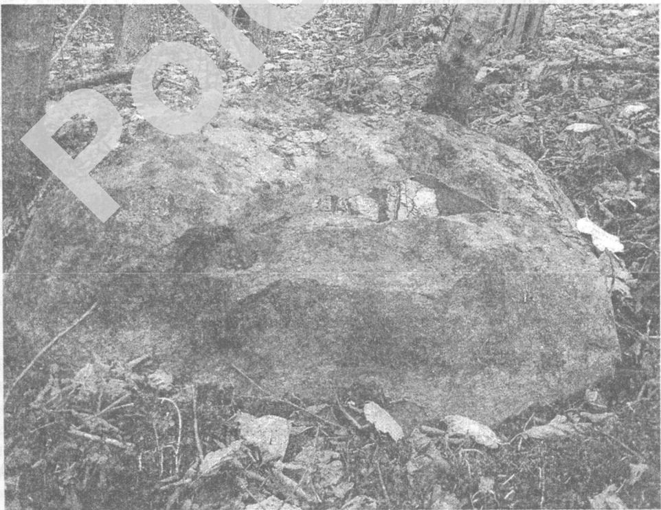
Мал. 4. Культывы камень з лекавай вадай ля г. Каўказ

Правей стаўка, у 200 м на ўсход ад г. Каўказ выяўлены комплекс камянёў. З поўночнага боку ляжыць буйная пляскатая камлыга буйназярністага граніта, якую называюць Ложкам. Ніжэй «Ложка», у 7 м на паўночны захад, знаходзіцца камень з паглыбленнем, у якім скапліваецца лекавая вада (мал. 4).